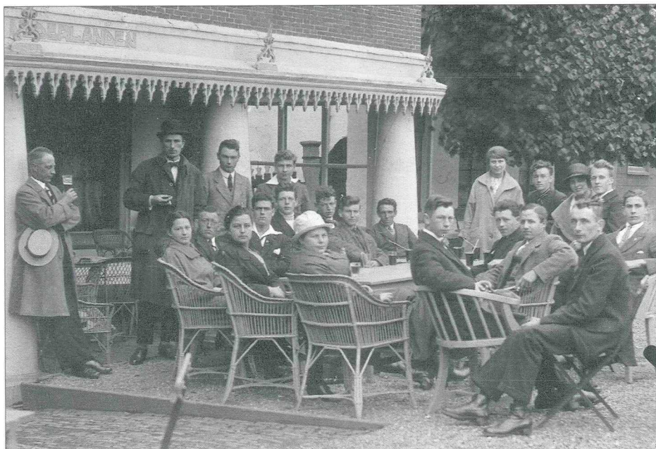
Een gezelschap bij hotel 'De Nederlanden' in 1911. Dit zou een deel van de leden van de Utrechtse Bloemisten Patroonvereniging kunnen zijn, die op 22 augustus van dat jaar een bezoek bracht aan kwekerij 'De Morgenzon'.

genzon' oprichtte, was hij al actief als bloemenkweker in Vreeland, getuige een advertentie in het vaktijdschrift Floralia van 31 mei 1901, waarin hij - tegen concurrerende prijzen - vaste afnemers zocht voor witte waterlelies. Op 18 januari 1906 kocht hij van Theodorus Johannes Schipperrijn, grondeigenaar te Maarsseveen en Jan Plomp, grondeigenaar te Maarssen 4) voor de prijs van 4.120 gulden het huis met erf en tuin kadastraal sectie A nummer 1036 ter grootte van 25 are en 30 centiare. Het adres van dit perceel was in latere jaren Oostelijke Vechtdijk 151 (1942) en Boslaan 7 (1954). In de koopakte van 1906 was al sprake van bloemenkassen. Op grond van een mededeling van Huibert van Mastrigt in 1908 aan een journalist van het tijdschrift Onze Tuinen moet op het desbetreffende perceel voor 1906 al zo'n twintig jaar een kwekerij hebben bestaan, zij het op kleinere schaal dan zijn bedrijf 'De Morgenzon'. Op de oude kwekerij werd voldaan aan de plaatselijke vraag naar potplanten voor tuin- en kamerversiering. Niet bekend is wie zijn voorganger is geweest, mogelijk was dat zijn vader Willem. Het kan ook zijn dat zijn vader daar in loondienst heeft gewerkt. Vermoedelijk is de aankoop van het perceel in 1906 en de uitbreiding van