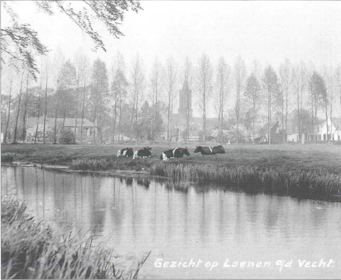
Gezicht op Loenen qd Vecht.

Het land "Cronenburgh", waarop de uitbreiding zou plaatsvinden. Foto circa 1935.