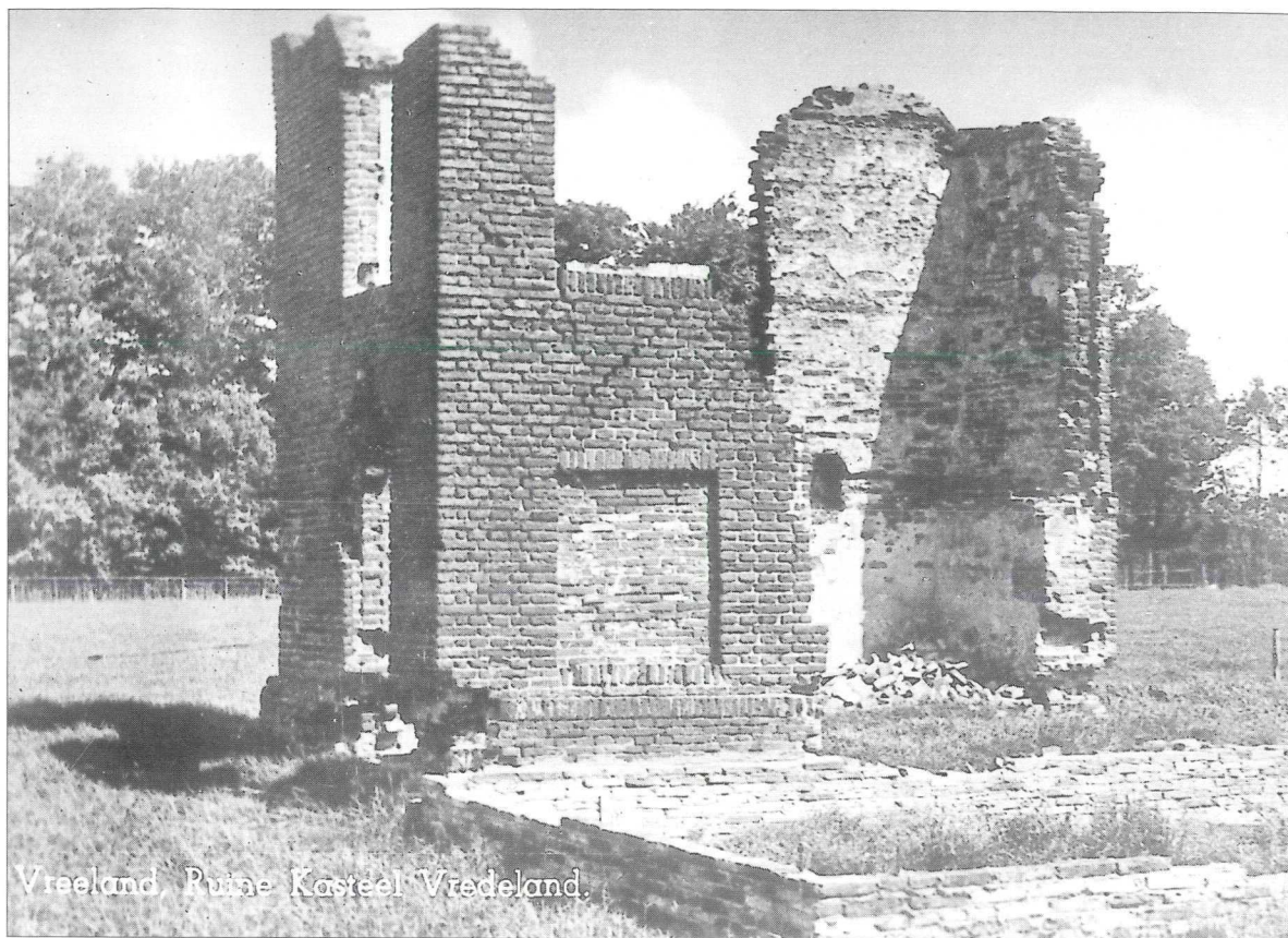
Ruïne van het huis dat in de 17 de eeuw op het kasteel- terrein is gebouwd.

gelijk. Het kasteel zou weer in Hollandse handen vallen. Ruim een week na deze uitspraak overleed bisschop Van Vernenborch, misschien wel van de schrik over deze afloop van de zaak. Diens opvolger Arnout van Hoorne, hield zich niet aan de uitspraak van de Gelderse hertog.