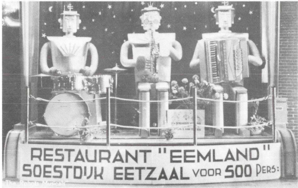
1956 "The Robots Musical" in Eemland.

Soestdijk, - Wat men in Amerika en Rusland (nog) voor onmogelijk houdt, wordt in Soestdijk werkelijkheid.