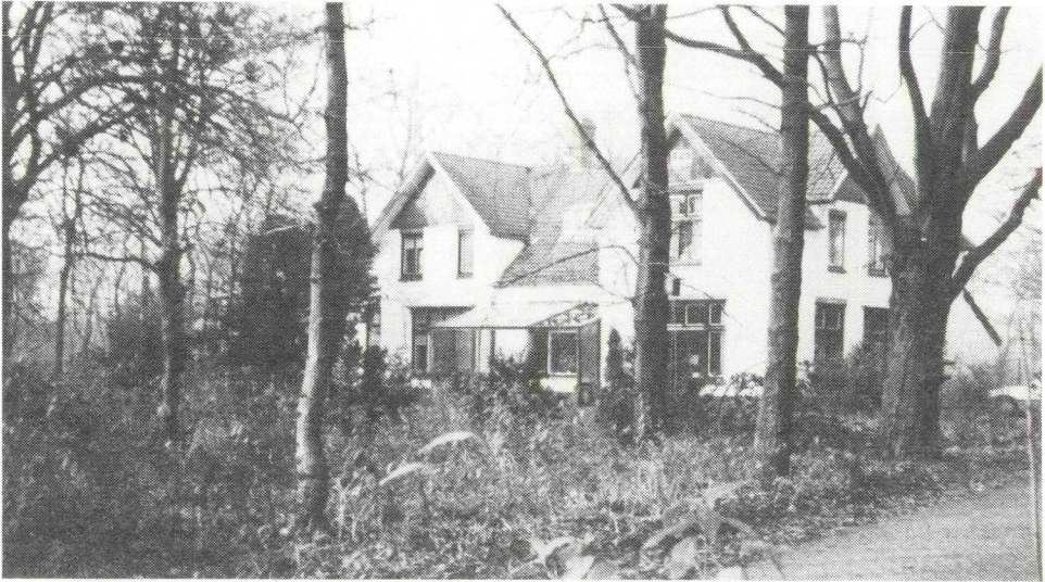
„Vredehof” nu Bosstraat 12 en 14.