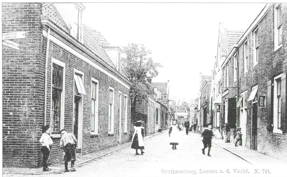
Grutterstoeeg, Loenen a. d. Vecht. N. 744.