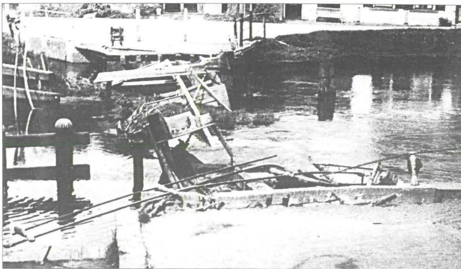
In de laatste oorlogsdagen is de oude klapbrug van Vreeland door de bezetter vernietigd.