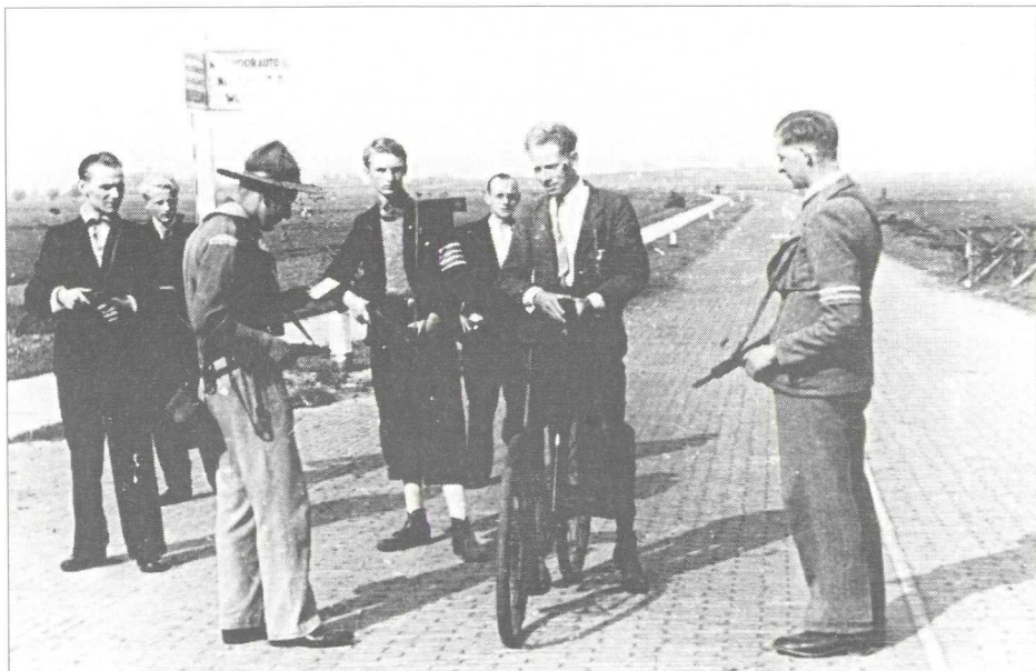
Bij de bevrijding van ons land: controle door de Binnenlandse Strijdkrachten aan de Provinciale Weg in Vreeland.