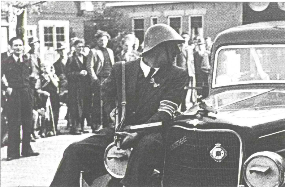
Leden van de Binnenlandse Strijdkrachten (BS) na de bevrijding op pad voor de arrestatie van NSB'ers.

Na een paar uur werden de beide predikanten echter vrijgelaten op voorwaarde dat zij hun best zouden doen het aantal arbeiders op 120 te brengen. Bovendien werd bedreigd een aantal huizen in brand te steken. Iedereen sloeg de schrik om het hart, behalve NSB-burgemeester H.J. Doude van Troostwijk. „Dan moet de bevolking ook maar niet zo dom zijn”, was zijn laconieke commentaar op de terreur van Duits zijde.