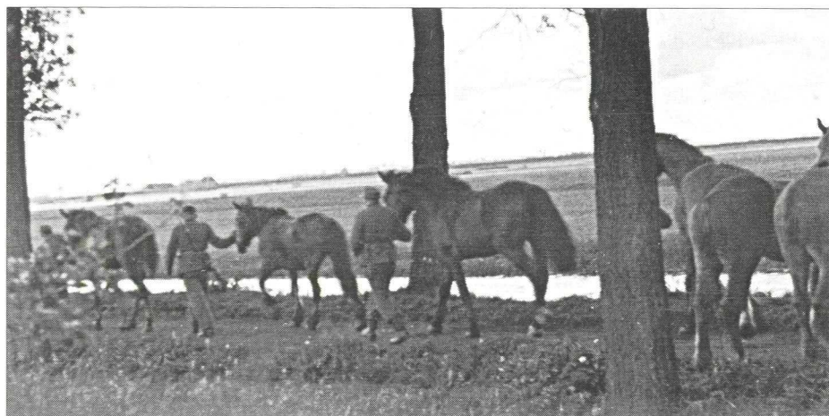
Gevorderde paarden worden in Loenen door de bezetter vanaf de Bloklaan weggevoerd.

In politiek opzicht waren de agrarische dorpen Loenen, Loenersloot, Nieuwersluis, Nigtevecht en Vreeland in die jaren confessionele bolwerken. De RKSP, de ARP en de CHU konden in de gemeenteraden rekenen op een ruime meerderheid. Niettemin werden tientallen inwoners van Loenen, Loenersloot, Nieuwersluis, Nigte-