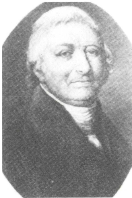
Professor J.H. van der Palm