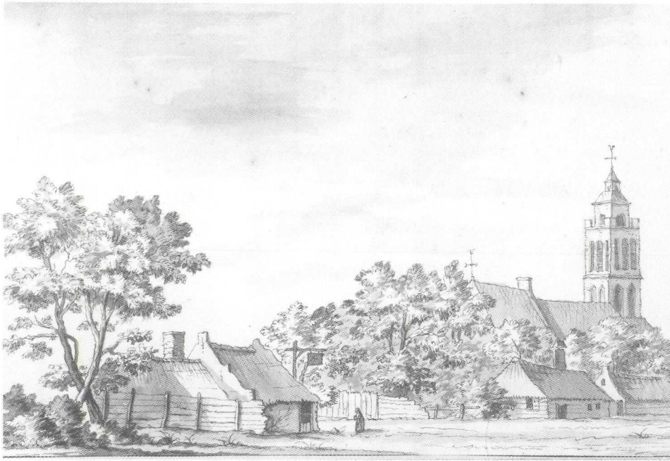
Gezicht op de kerk en huizen in Westbroek.

L.P. Serrurier Topografische Atlas, R.A.Ü., inv. nr. 1837. Pen en penseel in grijs.