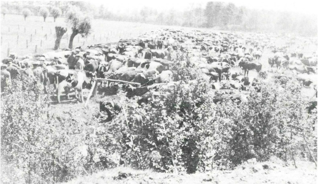
Voordat de evacuatie van de koeien naar Wijk bij Duurstede begon, werden ze bijeen gedreven in enkele weilanden.

Een groot gedeelte van de veestapel werd afgevoerd naar Wijk bij Duurstede. De koeien werden via het wegenstelsel te voet naar de plaats van bestemming gebracht. Een deel van het vee bleef daar en een ander deel werd met schepen afgevoerd naar Zuid-Holland. De paarden waren al gevorderd voor het Nederlandse leger. Kippen en varkens bleven achter, voorzien van een grote hoeveelheid voer. Niemand wist echter hoe lang de strijd rond de Grebbelinie zou duren. Na de capitulatie op 15 mei 1940 kwamen de dorpelingen terug en ook de koeien. De boeren kregen 70% van de koeien terug. De overige 30% was doodgeschoten of verdronken, waarvoor de boer later schadeloos werd gesteld. Het vee was in kwaliteit sterk achteruit gegaan en vaak niet eens gemolken. De fabriek was gesloten van 11 tot en met 16 mei 1940. Op 17 mei 1940 was er weer melkontvangst.