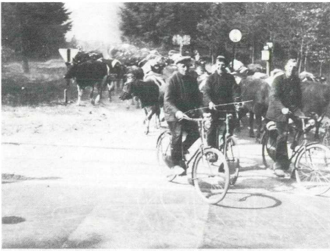
Onder begeleiding werden de koeien geëvacueerd uit het bedreigde gebied van Woudenberg met omstreken.

Eén van de in de fabriek gelegeerde Nederlandse militairen heeft de oorlogsdagen niet overleefd. Vanuit een stelling schoot hij op een Duits vliegtuig, dat kwam overvliegen. Vanuit het vliegtuig werd teruggeschoten en één van de kogels raakte de militair dodelijk.