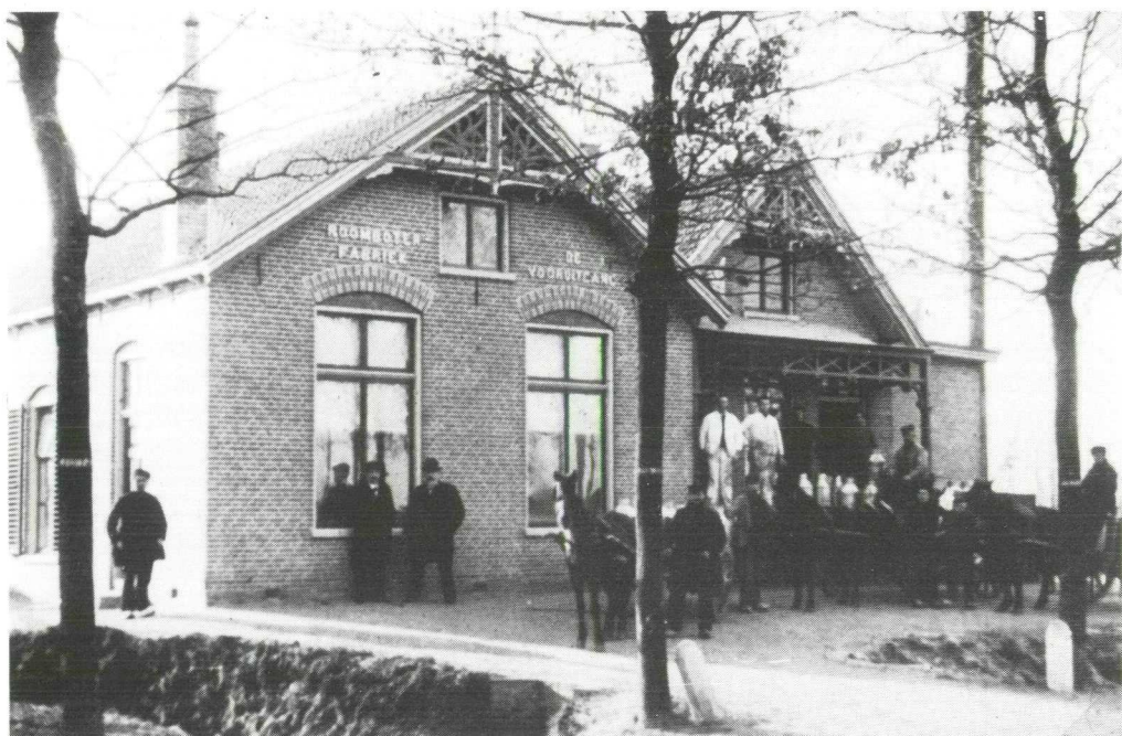
Deze foto is in 1900 gemaakt; het jaar van de oprichting van de naamloze vennootschap. Op de foto staan de heren De Beaufort en Douma vóór het gebouw.