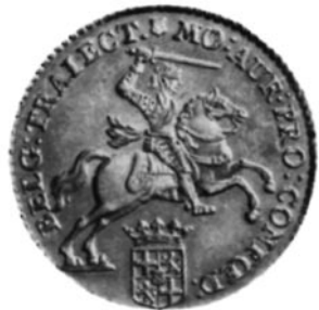
vergroting ca. 130%

Gouden munten spreken altijd tot de verbeelding, dus laten we onze fantasie eens de vrije loop. Als we aannemen dat de koper de koopsom van f 990,- in gouden ridders bij de notaris heeft uitgeteld, dan zullen dit er dus ruim 70 zijn geweest, met een gewicht van ruim 700 gram. Al met al een redelijk geldzakje vol, dat de verkopers thuis op een veilige plaats hebben verstopt. Na hun overlijden weten de erfgenamen van niets en stel dat eerst in 2008 het geldzakje wordt ontdekt. De vinder heeft dan een fortuin in handen, want de huidige waarde van deze munten bedraagt ca. € 960,- per stuk, dus zou hij bij verkoop ruim € 66.000,- kunnen ontvangen. Overigens is, gerekend naar de koopkracht van dit moment, het bedrag van f 990,- in 1762, te vergelijken met ca. € 7.800,- (f17.189,- nu. 14 )