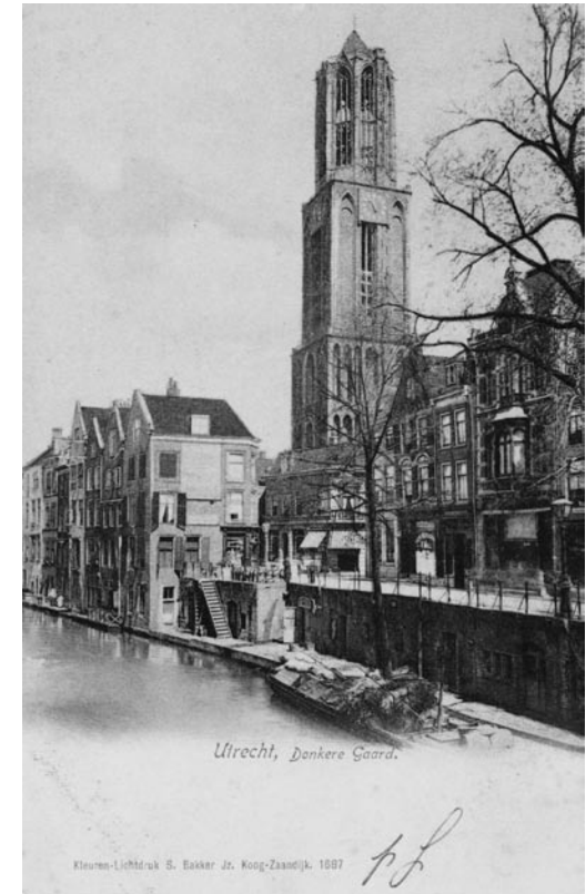
Ansichtkaart rond 1900