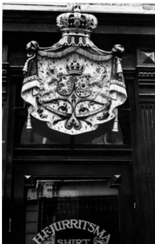
Het wapen van Koningin Emma