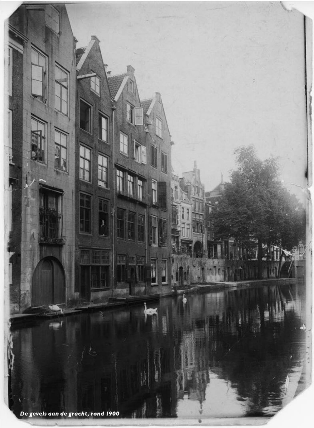
De gevels aan de gracht, rond 1900

Met gebrek aan ervaring, maar wel met veel enthousiasme, heb ik ingezet op het in kaart brengen van gegevens van alle huizen in de Donkere Gaard, voor zover gelegen langs de Oudegracht, te weten de nummers 1 tot en met 13 en tevens het medio 1600 afgebroken pand aan de zuid-zijde. De onderzoeksresultaten waren echter zo talrijk, dat voor een uitgave in dit kader een keuze moest worden gemaakt. Het is begrijpelijk dat de keuze dan ook gevallen is op de panden Donkere Gaard II-I bis, waar mijn vrouw een groot deel van haar jeugd heeft doorgebracht en mijn schoonvader bijna 50 jaar zijn brood heeft verdiend. Zijn liefde voor deze panden en haar belang voor de Utrechtse binnenstad deed hem, in 1961 besluiten tot restauratie, waaraan ook het UMF haar medewerking verleende.