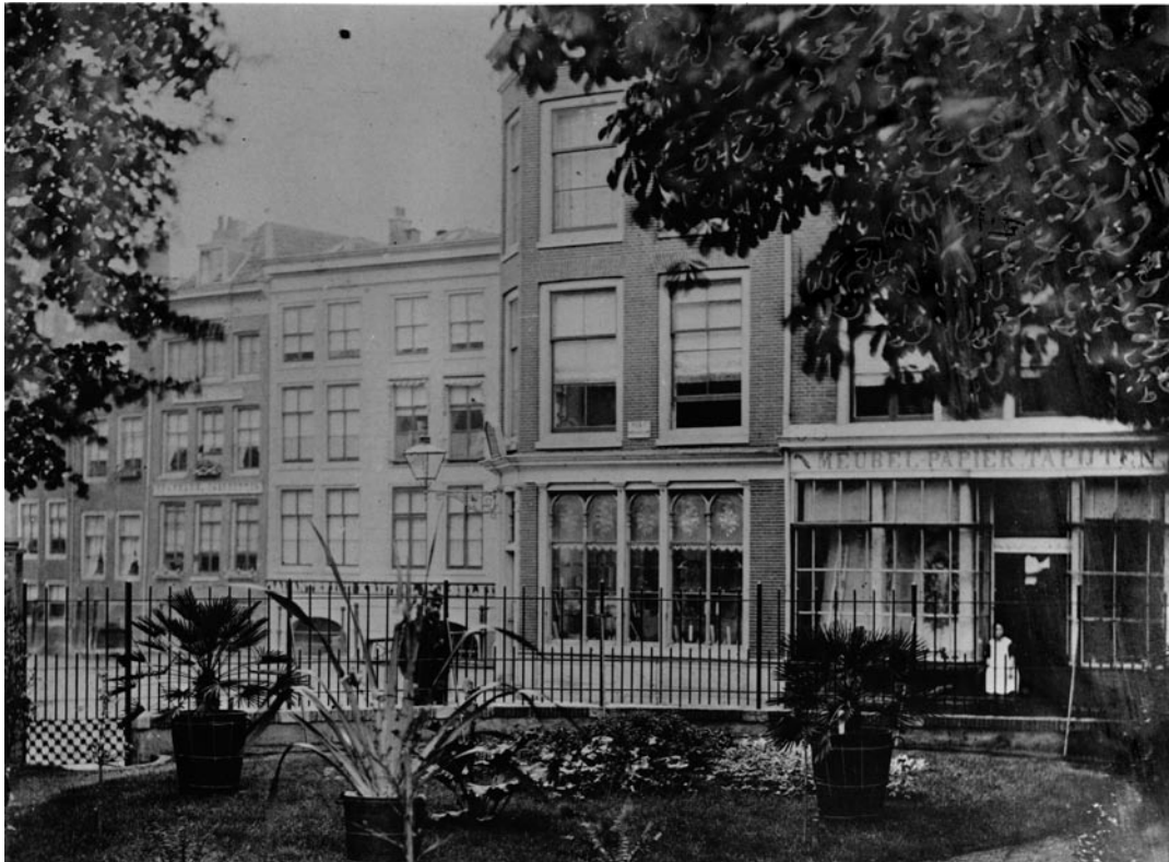
Foto vanuit de tuin van Donkere Gaard 4

ningen die met elkaar verbonden zijn door tussendeuren. Hoe het pand er daarna zal hebben uitgezien blijkt uit een foto die omstreeks 1870 werd genomen, vanuit de tuin bij het tegenover gelegen huis, Donkere Gaard 4 (Flora's Hof).