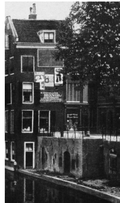
De kelders van nummer 15 (afgebroken) en op de plaats van het wed hebben aan de gracht nog de oude middeleeuwse rooilijn. (deel van een oude ansichtkaart).