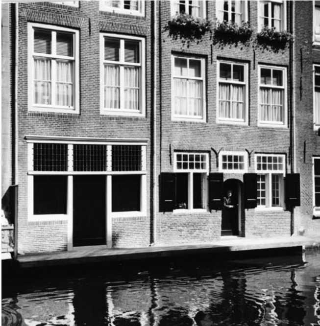
Keldergevels van 11bis en 11

ingang van 1 november 1898 aan de eerdergenoemde H.F. Jurritsma, met het recht van koop voor dezelfde prijs, waarvoor de verhuurder het pand heeft gekocht. Het heeft er veel van weg dat de baron goed te spreken was over de leveranties van deze winkelier, dat hij zo'n riante afspraak wilde maken.