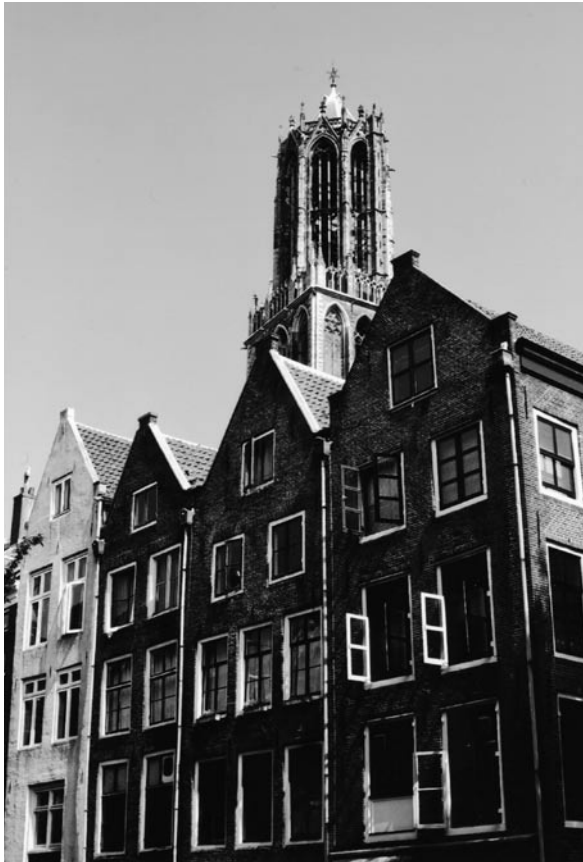
de toppen van de gracht-gevels van Donkere Gaard 9, 11bis, 11 en 13