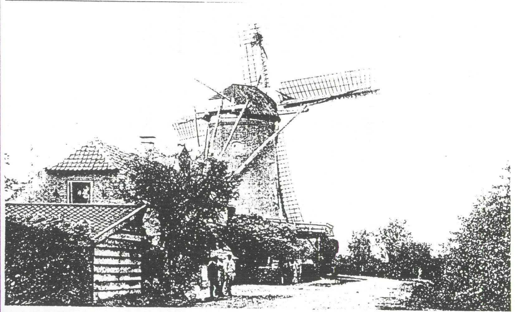
„DE TROUWE HULP“ WOUDEMBERG