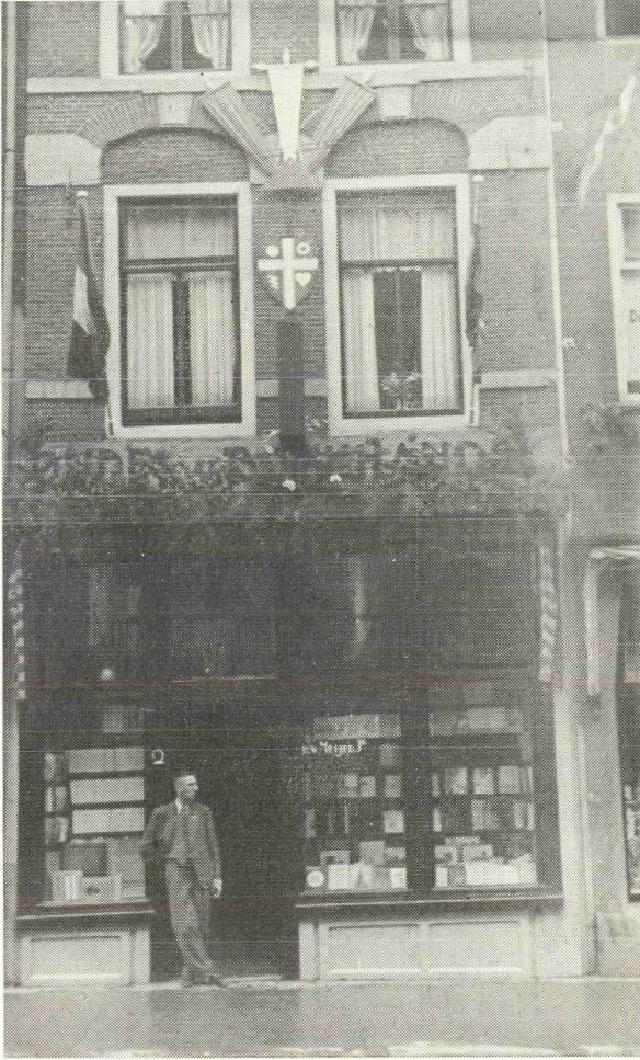
Korte Jansstraat 2 in oude gedaante.

Schoutenstraat 13. In aanvulling op hetgeen in het juni-nummer van Oud-Utrecht (blz. 77 e.v.) is medegedeeld kunnen wij thans berichten, dat het dank zij de opmerkzaamheid van een onzer leden mogelijk is geweest, de deuropzetting met de „Dubbelden Arend” wederom ten behoeve van de restauratie terug te kopen.