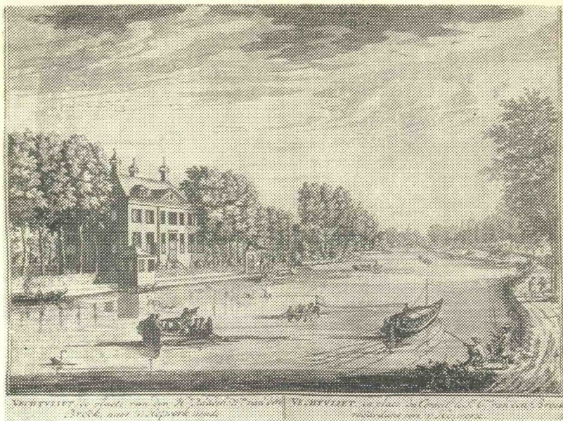
Vechtvliet — één der illustraties uit het boek van dr. R. van Luttervelt.