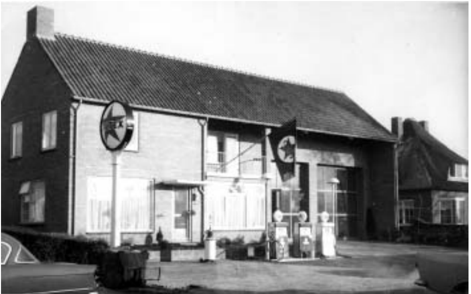
Vernieuwde garage Koot (ca. 1962).

Al in de tijd van Wim van IJken stond er één pomp. Die nam Kees in 1956 over. Na een korte periode met twee pompen werden het er uiteindelijk drie. Dat bleef ook zo na de nieuwbouw in 1962. Rob: “Op zondag was de benzine-