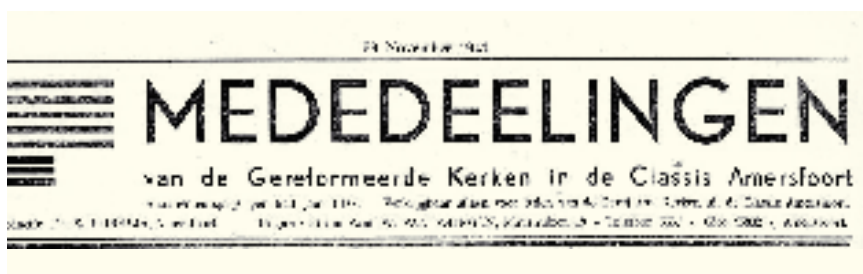
Titelkoppen van 1931, 1941, 1944

moeten verschijnen, was het vanzelf niet doenlijk dat alleen de beide predikanten voor geheel den inhoud zouden zorgen. En zoo kwamen wij toen terecht in de combinatie van andere kerkbladen.' Een belangrijk voordeel van ON is dat de predikanten uit de classis voortaan zelf de meeste rubrieken gaan schrijven, in plaats van citaten uit landelijke bladen. Hun teksten zijn vervolgens beschikbaar voor alle betrokken bladen. Popma is de verdere jaren dertig eindredacteur van de Amersfoortse kerkbode.