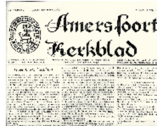
Titelkop van 1963

publiceerde: De Stuw (1946-'49). 33 In juni '56 begint Engelkes met de nieuwe rubriek Amersfoorts Jeugdnieuws . In augustus '58 schrijft hij voor het eerst en positief over 'De vrouw in het ambt'. Het gesprek gaat in de jaren vijftig vaak over emigratie, maar ik vond slechts drie artikelen: in juni 1950 en april 1952.