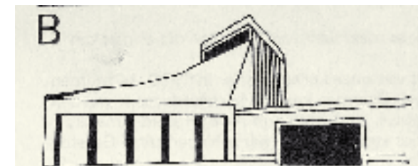
Wijklogo's van Klaas op 't Land uit 1975 en 1979: in dit geval de Fonteinkerk.