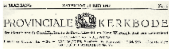
De scheuring in titelkoppen uit 1945