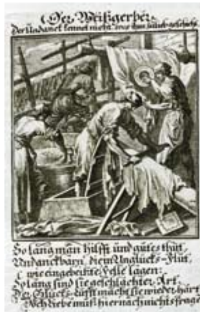
← Der Weissgerber.

stelling van het eiwit in de huid en werd de huid voor bederf behoed. Na het doden werden dieren gevild en de huiden gingen naar de leerlooier, vaak met de resten van kop en poten er nog aan. Als de looier zijn huiden geleverd kreeg, moesten eerst de niet bruikbare delen, hoorns en poten, worden verwijderd. 4 Wanneer de looier zijn waar niet direct kon verwerken werden de huiden met zout geconserveerd tot het moment dat hij er aan toe was. Vervolgens werden de huiden met een schraapmes van resten vlees en vet ontdaan, die op de huid waren achtergebleven, het zogenaamde "ulezen". Voor de productie van leer moesten de huiden worden onthaard. Ze werden daartoe geweekt in kalkhoudend water, waardoor het weefsel opzwol en van structuur veranderde. Al doende werd het ontharen van de vellen vergemakkelijkt. Deze bewerking werd "ploten"