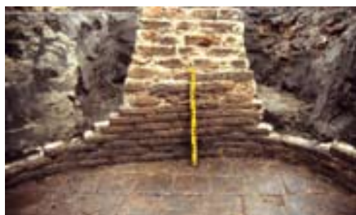
Stenen kuip Mooierplein.

plein werd een ronde houten bodem gevonden. De overeenkomst met de kuip, zoals die gevonden is in Den Bosch, lijkt voor de hand te liggen. In de gevallen dat we alleen nog maar de contouren van de kuip, uitgevoerd in klei vinden, is dat omdat bij afdanken van de kuip het nog bruikbare hout eruit is gehaald. Bij een andere opgraving aan de Utrechtsestraat vond men een kleibak die aan de binnenzijde nog afdrucken van vlechtwerk vertoonde. Het hout van het vlechtwerk is door de bodemomstandigheden niet bewaard gebleven, maar het is wel duidelijk dat men hier gekozen heeft voor een, minder dure maar ook minder duurzame variant van de houten kuip. Op het Mooierplein zijn drie van zulke met leem besmeerde kuipen gevonden en nog een bakstenen kuip met een vloer van plavuizen. Noch de plek van het Mooierplein noch die van de Utrechtsestraat zijn ons bekend als locatie van leerlooiers en lijken gezien het ontbreken van water in de nabije omgeving daartoe ook nauwelijks geschikt. 21 Uiteraard stond deze techniek om een stevig en waterdicht reservoir te maken ook ten dienste aan andere middeleeuwse