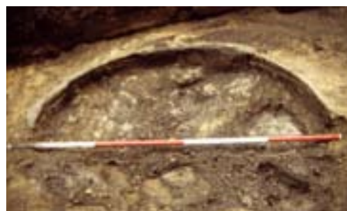
Lemen kuip met houten bodem Mooierplein.

De belangrijkste grondstof voor looiers is het looizuur dat opgesloten zit in een aantal planten en bomen, waarvan in ons land de belangrijkste de eik was. In het jonge hout is de concentratie