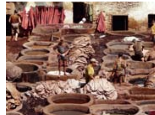
Een traditionele leerlooierij in Marokko.

Intrigerende vondsten, aan het licht gekomen bij archeologisch onderzoek op een terrein aan de Westsingel, waar in 2008 een oude bioscoop gesloopt werd om ruimte te maken voor nieuwbouw, waren aanleiding voor historisch onderzoek.