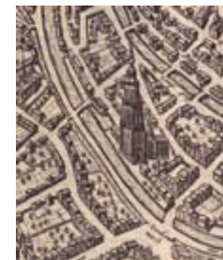
← Detail plattegrond van Amersfoort, Blaeu 1649.