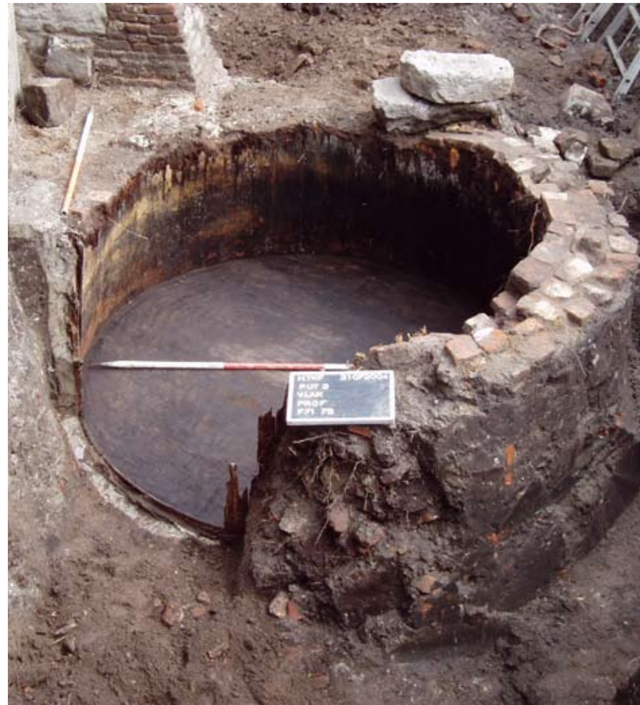
Lemen looikuip met hout verstevigd.