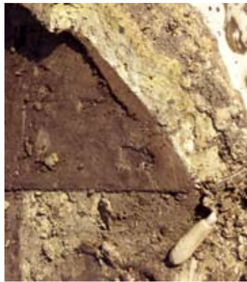
Restant van lemen kuip Utrechtsestraat.

Op het terrein aan de Westsingel werd tijdens de opgraving een drietal putten gevonden die geassocieerd konden worden met leerlooiers. Eén daarvan was een bakstenen put met een bodem van plavuizen, rechthoekig van vorm maar met sterk afgeronde hoeken. De put is bewaard gebleven tot een hoogte van 1.45 m met een doorsnede van ongeveer 1.60 m. Twee andere sporen tekenden zich bij het archeologisch onderzoek aanvankelijk af als cirkels met een diameter van iets meer dan twee meter. De buitenkant van de cirkel werd gevormd door een band grijsblauwe klei met een breedte van 10 tot 30 cm en een diepte van maximaal 10 cm. Het binnenste van de cirkel bestond uit zand met klonten klei. De twee kleicirkels lagen dicht tegen elkaar aan, maar zonder elkaar te raken. Vondsten werden niet aangetroffen, zodat de datering niet helder is. 19 Bij archeologisch onderzoek in Amersfoort vindt