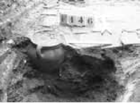
Voorraadpot in de functie van stofpot in de hoek van de 17 e -eeuwse kelder

beerlaag waarin helaas geen vondsten. Gezien de scherven van een roodbakkende en geglaazuurde pot in de overloop, stamt de put uit de 15 e eeuw. Twee baksteenfunderingen in de onmiddellijke omgeving doen vermoeden dat in de 15 e /16 e eeuw het midden van het perceel bebouwd was.