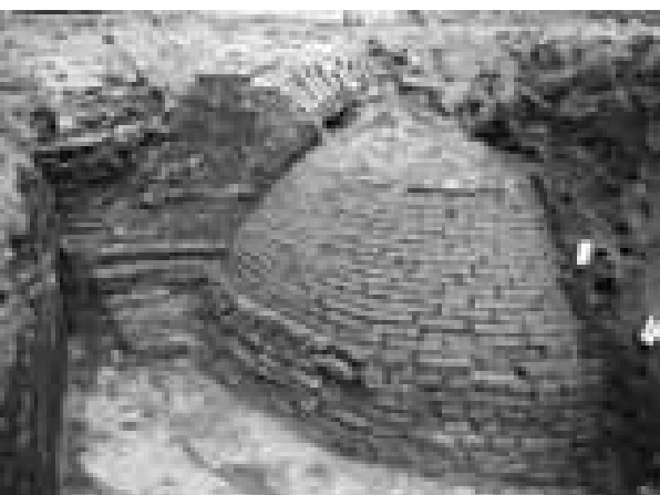
Beerput uit circa 1500

meer om de stallen makkelijk schoon te maken. In 1904 brandde het hotel geheel uit en werd afgebroken. De stallen ontsnapten aan de vlammen en werden in 1925 verbouwd tot garage Molenaar. Niet lang hierna kreeg het pand de functie van bioscoop.