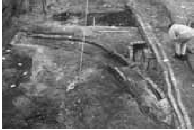
Bakstenen afvoergoten met overkluising uit de 18 e /19 e eeuw

Op en in de vulling van de sloot uit de 14 e eeuw bevond zich het restant van een bakstenen put. Deze had een wand van één baksteen dik en op de bodem bevond zich een laag klei. Het bleek te gaan om een leerlooierput, waarin koeienhuiden in een looistof werden bewerkt. Hierbij diende de fijne klei om deze waterdicht te maken. In dezelfde slootvulling als de bakstenen put bevonden zich op enige afstand twee opmerkelijke leemcirkels met daarbinnen brokjes leem. Vermoedelijk zijn het resten van kuilen waarin ooit looitonnen stonden. Het leerlooiersambacht zal hier zijn uitgeoefend in de 16 e en 17 e eeuw. Deze activiteit wordt bevestigd door de vondst van afval van leer en met name door veel hoornpitten van runderen in de vulling van de Hellegracht. De huiden werden inclusief hoornpitten bij de looiers aangeleverd. Transportregisters uit de 16 e en 17 e eeuw vermelden – met name in de westelijke, laatmiddeleeuwse stadsuitbreiding – schoenmakers met looiputten (en kleiputten). De kaart van Blaeu (1649) illustreert dit verschijnsel: achter de