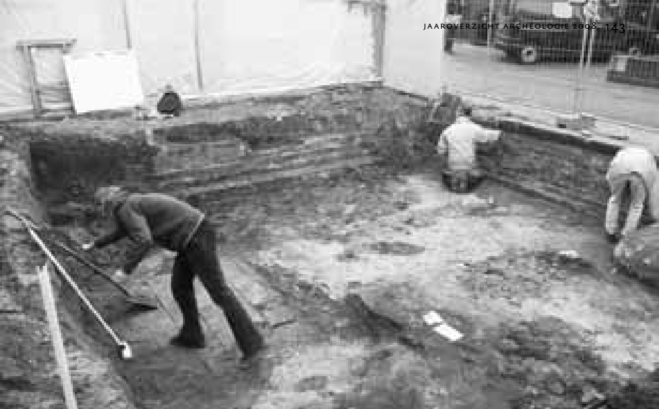
Archeologen werken op de opgraving aan Koestraat nr. 14 – 16

meer om de stallen makkelijk schoon te maken. In 1904 brandde het hotel geheel uit en werd afgebroken. De stallen ontsnapten aan de vlammen en werden in 1925 verbouwd tot garage Molenaar. Niet lang hierna kreeg het pand de functie van bioscoop.