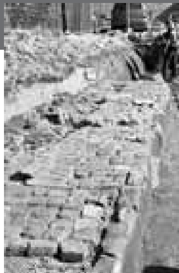
Fundering van een pakhuis uit de 15 e eeuw aan de Grote Koppel

De oudste sporen bestonden uit twee oost-west gerichte sloten, die gezien de aardewerkvondsten, in de tweede helft van de 14 e eeuw zijn