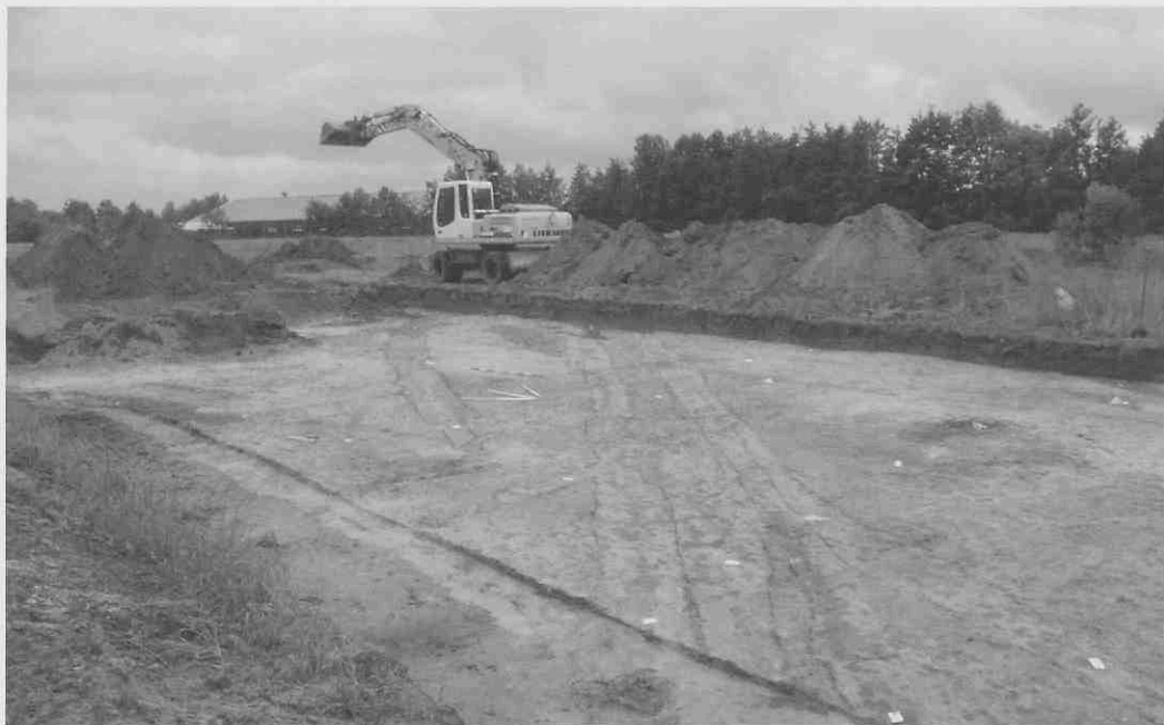
Opraving aan de Hogeweg (Wieken-Vinkenhoef); in het zand tekenen de karrensporen zich af.