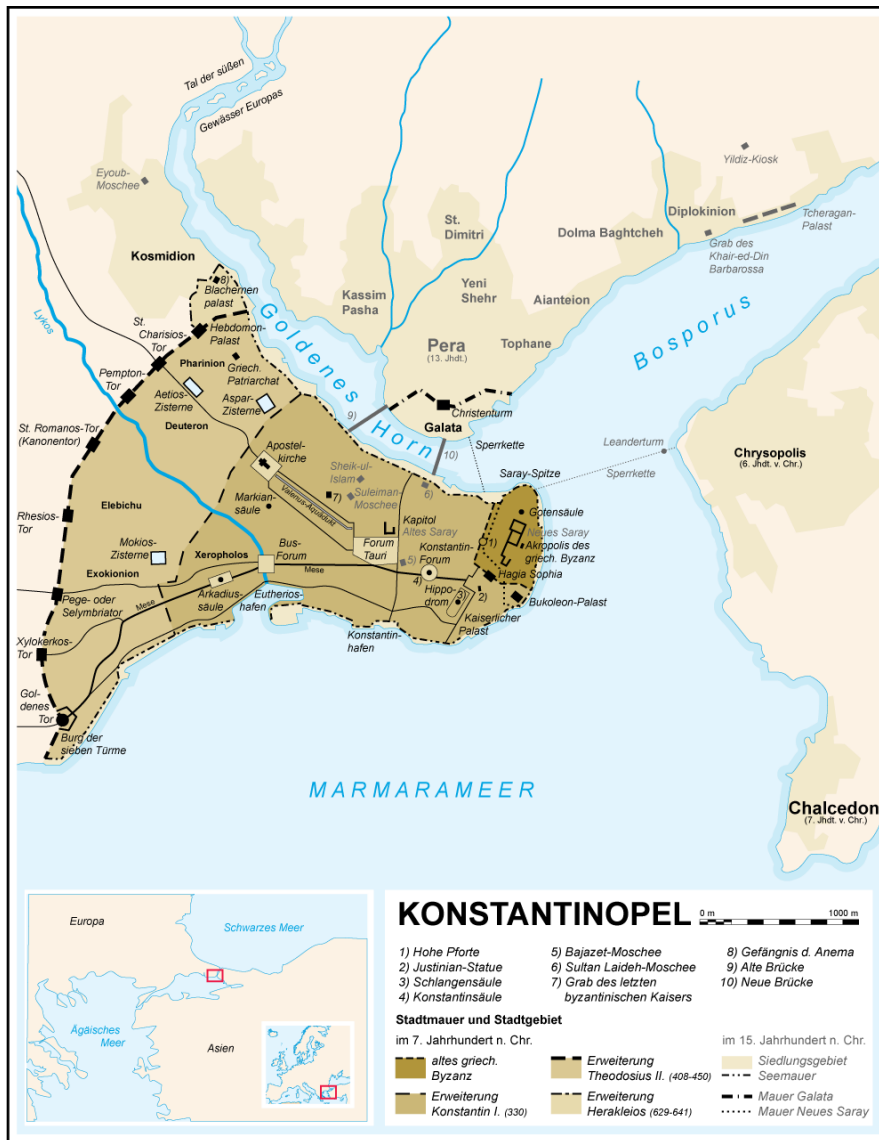
Afbeelding 6 – Topografische kaart van Byzantium/Constantinopel.