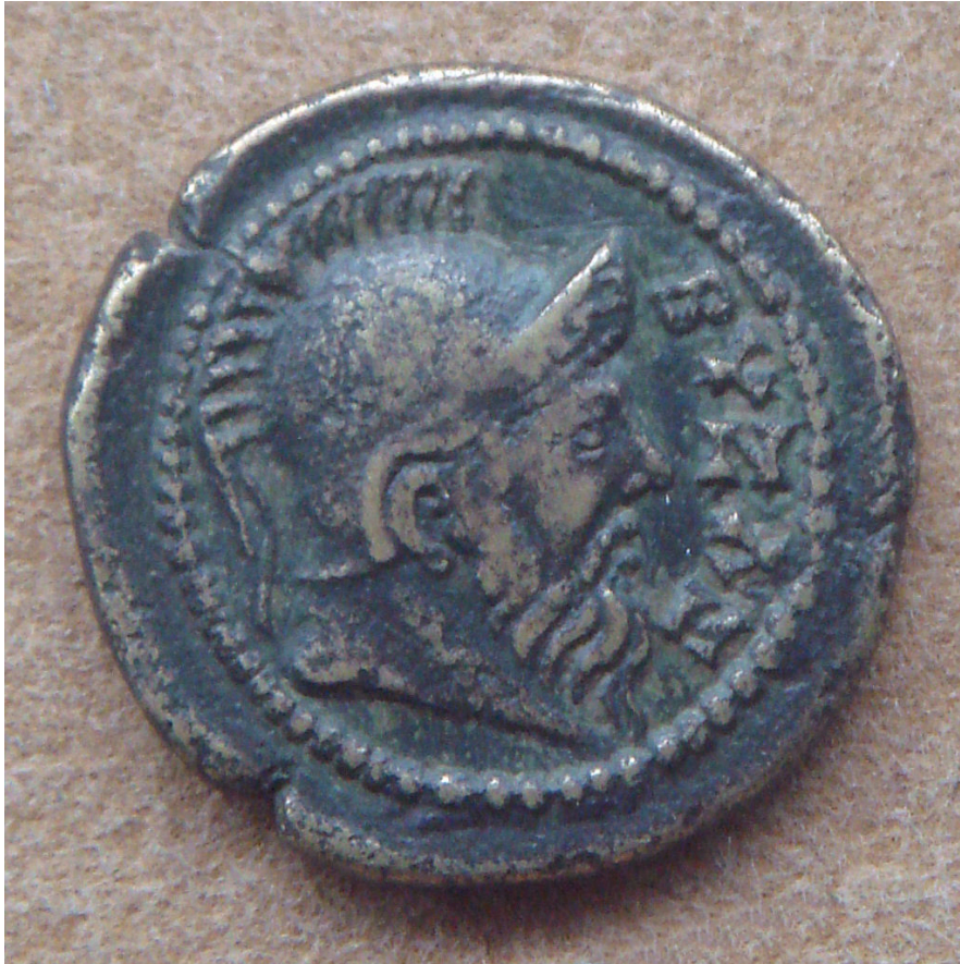
Afbeelding 5 - Afbeelding van de mythische stichter van Byzantium Byzas op een Romeinse munt uit de tijd van Marcus Aurelius (161-180).