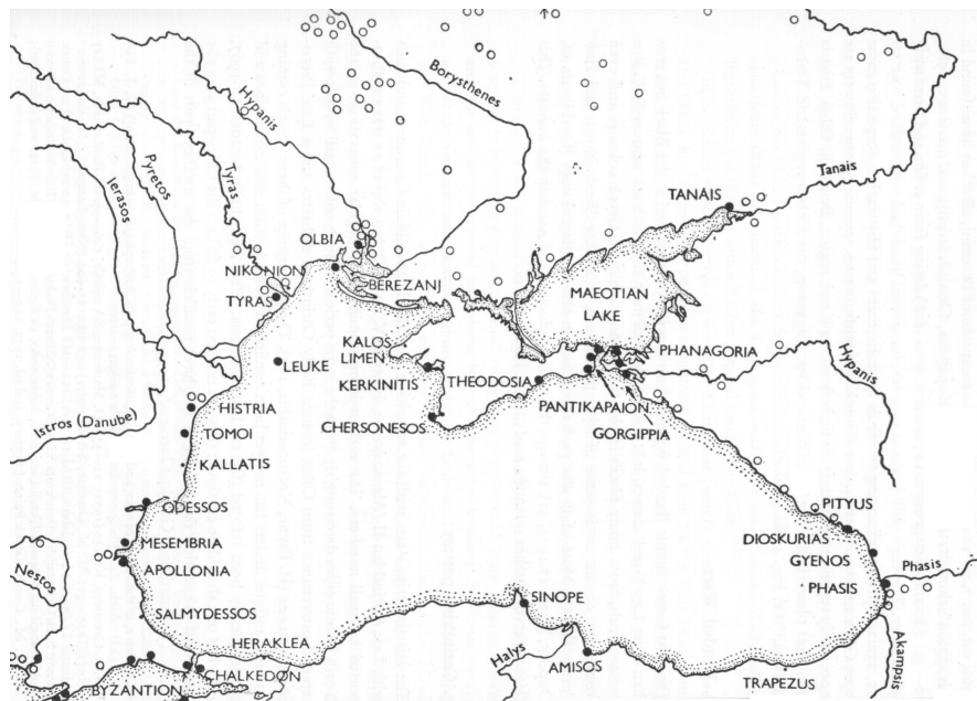
Afbeelding 4 – Griekse nederzettingen in het Zwarte Zeegebied.