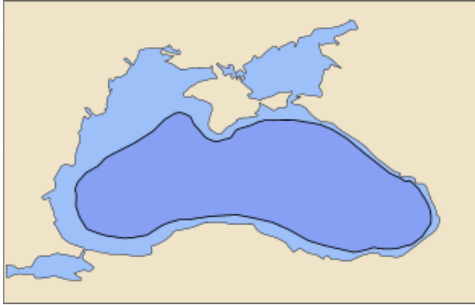
Afbeelding 2 - Zoetwaterbekken op de plaats van de huidige Zwarte Zee. Laatste IJstijd.