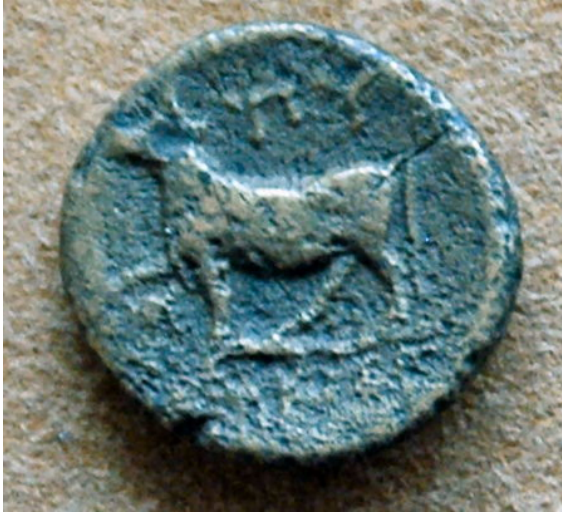
Afbeelding 1 - Byzantijnse munt (Istanbul Archeologisch Museum).