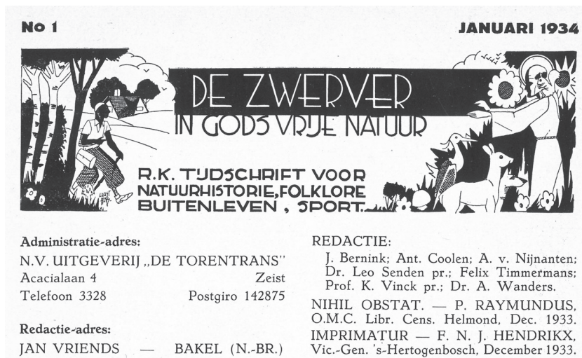
De titelpagina van het allereerste nummer van het tijdschrift De Zwerver in Gods vrije natuur , 1934.

Het tijdschrift De Zwerver in Gods vrije natuur knoopte banden aan met twee katholieke verenigingen: aan Vlaamse kant met De Wielewaal uit Antwerpen, 31 in Nederland met de Rooms-Katholieke Nederlandsche Natuur-Historische Vereeniging St. Franciscus van Assisië, gevestigd in Rotterdam. Het tijdschrift werd vermeld als officieel orgaan van beide verenigingen, wat suggereert dat ze een financiële bijdrage leverden en de leden automatisch abonnees waren. Het ledental van de Vereeniging St. Franciscus van Assisië was niet al te groot. In 1935 waren er slechts twee afdelingen, in Rotterdam en Amsterdam. Bovendien hield de vereeniging zich meer bezig met natuurstudie door middel van vogelkooien en aquaria dan met natuurbescherming in enge zin. 32