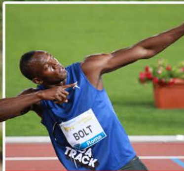
Dit was het nieuws! p. 14 en 15