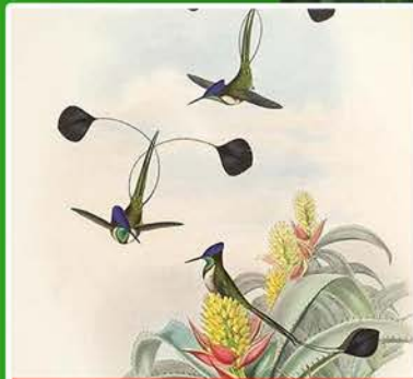
Wat als de wereld vergaat? p. 9