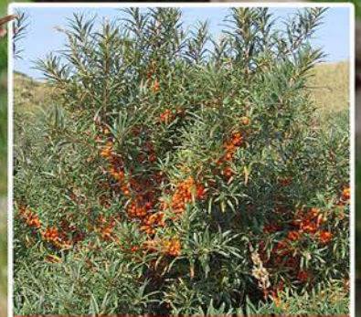
Uitwaaien op Ameland! p. 11