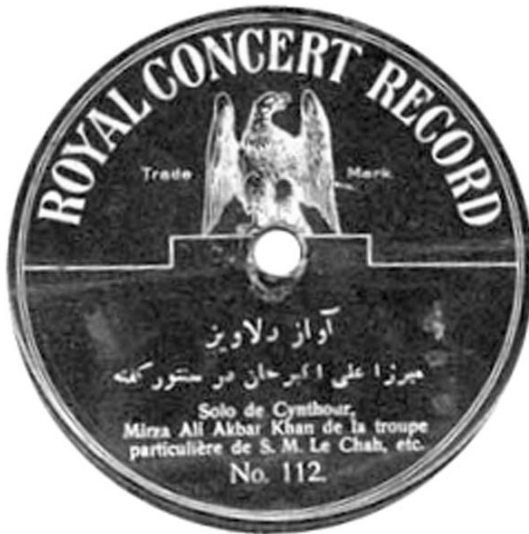
صفحه ده اینچ گرامافون، ضبط سال ۱۹۰۶، تکثیر غیر قانونی

تار مرتضی خان 7-219279 BT2699 دستگاه عشاق ص ۲۳۹ AX 389 c/w 7-219278