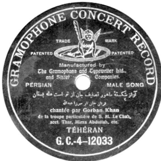
صفحه ده اینچ گرامافون، ضبط سال ۱۹۰۶