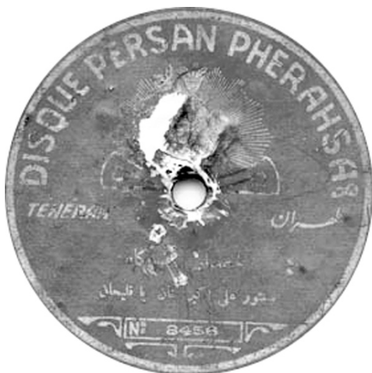
صفحه ده اینچ گرامافون، ضبط سال ۱۹۰۶، تکثیر غیر قانونی