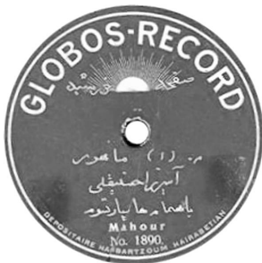
صفحه ده اینچ گلوبوفون، ضبط سال ۱۹۰۷

۱۹۱۵ آمیرزا حسین‌قلی نمره (۲) ابل c/w 1890