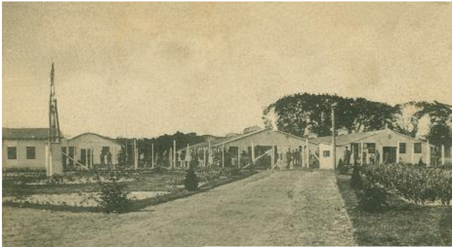
Internerings depot Bergen