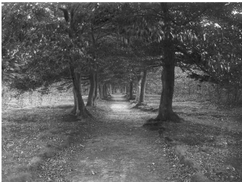
Laantje zonder Eind (ca. ).

Dat Oudemans de financiële draagkracht van de gemeente goed had ingeschat, bleek enkele dagen later. Op 10 september 1913 besloot de Gemeenteraad 'ter vergadering met gesloten deuren' om het Zeisterbos aan te kopen. Vlak daarna ontving de gemeente de goedkeuring van gedeputeerde staten voor de aankoop. Ondertussen was wel haast geboden. De erfgenamen hadden het bos aangeboden voor een openbare verkoping te Utrecht. De veilingcatalogus bevatte een lofzang op