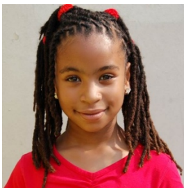
Van Antilliaanse afkomst

Tijdens het interview is gebruik gemaakt van foto's. Foto's kunnen de interviewer en respondent namelijk context geven en informatie, gevoelens en herinneringen bij de respondenten oproepen (Harper, 2002). De volgende migrantengroepen zijn door middel van de foto's gepresenteerd: mensen van Antilliaanse afkomst, mensen van Turkse afkomst, mensen van Molukse afkomst, mensen van Surinaamse afkomst en als laatst mensen van Marokkaanse afkomst. Voor deze groepen is gekozen omdat ze de grootste niet-Westerse groep allochtonen vormen in Nederland. De mensen van Molukse afkomst zijn hieraan toegevoegd omdat Drenthe een relatief grote Molukse gemeenschap kent. Om de respondenten niet te beïnvloeden in hun mening over het Nederlanderschap van deze groepen is geprobeerd de groepen met een neutrale term te beschrijven: onder elke groep staat de afkomst. Gedurende het gehele interview werd teruggevallen op de foto's, zo werd bij een hypothetische vraag gesteld: 'Stelt u eens voor dat zo'n meisje....'