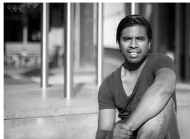
Van Molukse afkomst