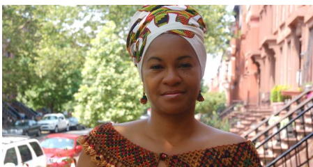
Van Surinaamse afkomst