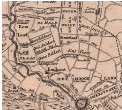
De omgeving van de stad, ca. 1740. Deel van de kaart van de provincie Utrecht door Tirion, Amsterdam, ca. 1740. Eén uur gaans is ongeveer 4,8 km. Coll. Museum Flehite, kaartnr. 1001_433.

Na hem bezocht een pater uit Nijkerk de gelovigen in onder andere Hoevelaken, Santbergh (waarschijnlijk de boerderij het Zandhuisje te Hooglanderveen die als schuilkerkje fungeerde) en Stoutenburg. Dit ging zo wel 27 jaren achtereen door, aldus de getuigenissen, dus vanaf circa 1644. 64 Hij trok rond naar de dorpen in een wijde omgeving, een gebied van ongeveer zes uur gaans of circa dertig kilometer. Hij leidde samenkomsten waarbij vaak twee- tot driehonderd per-