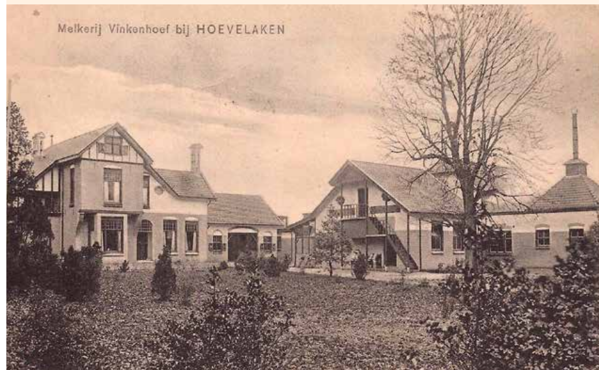
Een oude Ansichtkaart van buitenplaats Vinkenhoef.

Een herinnering aan deze belegering is het graf van een Pruisische soldaat – dat nog steeds in de nabijheid van paleis Soestdijk ligt – en een standbeeld dat ter ere van hem is opgericht. Een artikel uit de Hollandsch Historische Courant nr. 91, van dinsdag 31 juli 1787, door D.E. Cohen in zijn familiegeschiedenis aangehaald, doet verslag van de afloop van de aanval: