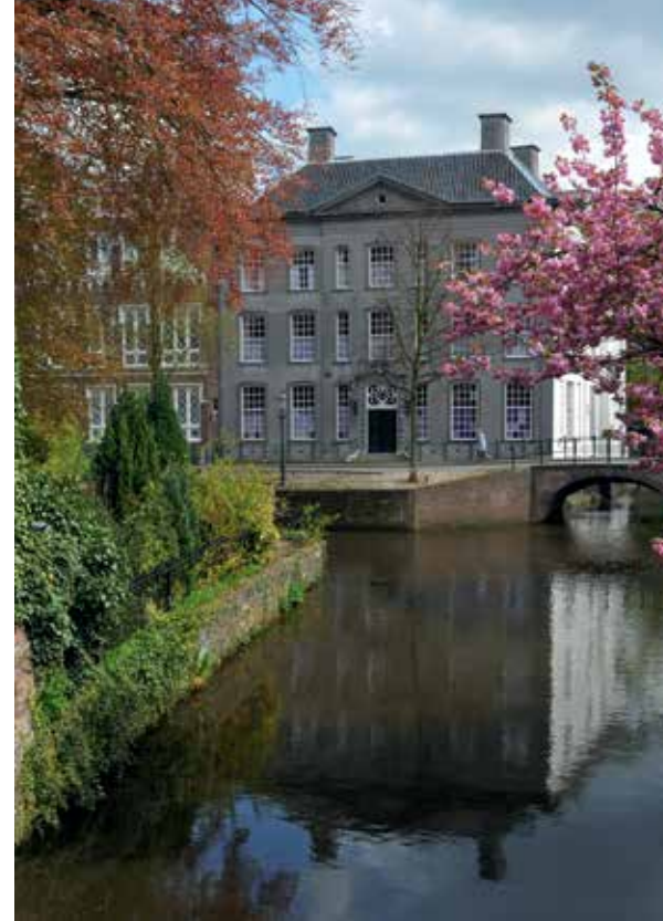
Het Huis met de Paarse Ruitjes, dat door een Duits bataljon werd vernield.