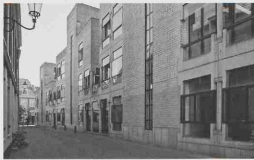
Kerkstraat met hoofdingang.

Nu gemeentebesturen zelf kunnen beslissen of een gebouw behouden blijft, groeit de bezorgdheid over het behoud van naoorlogse,