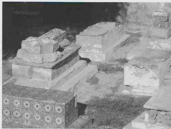
← ← Toegang tot de begraafplaats van Tripoli