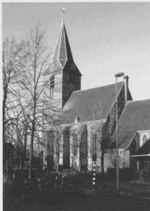
Hervormde kerk in Olst