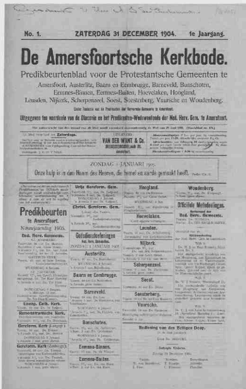
Kerkbode van 31 december 1904 (Persmuseum 4051)

Al twaalf dagen later vergadert men over een 'zeer uitgewerkt overzicht' van Wesseling, die zelfs al enkele proefnummers kan laten zien. Wat hem betreft kan op 31 december het eerste nummer verschijnen! Omdat er te weinig leden aanwezig zijn voor een quorum komt men de volgende dag, dinsdag de 20 e , om 12.15u opnieuw bijeen. Wesseling legt nu een conceptreglement voor uitgave en financieel beheer op tafel. Dat wordt overgenomen, maar op voorstel van Ds. D.J. van Aalst (predikant te Amersfoort 1901-1906) worden de baten bestemd voor de Weduwenbeurs der Hervormde Predikanten te Amersfoort (f40 per jaar) en 'ook eenig voor-