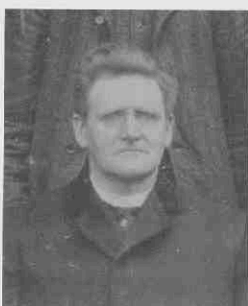
↗ F. Wesseling, 1906/7. Detail van een foto door H. Sanders & Co (Archief Eemland 13513)

deel' voor de diaconie. Bij het Utrechtsch Predikbeurtenblad geeft men de opbrengst ook aan het Weduwenfonds, een indicatie dat dit blad als voorbeeld dient. De commissieleden vormen samen met de drie predikanten de redactie; Vels Heijn wordt tevens 'controleur op het financieele beheer'. Als hoofdagent voor de verkoop wordt J.H. in 't Veld aangewezen, geen boekhandelaar maar een ambtenaar van de spoorwegen; daarnaast nog twee agenten die ambachtslieden zijn. Eén van de laatsten bedankt echter meteen en ook In 't Veld is spoedig verdwenen. 7 In het eerste