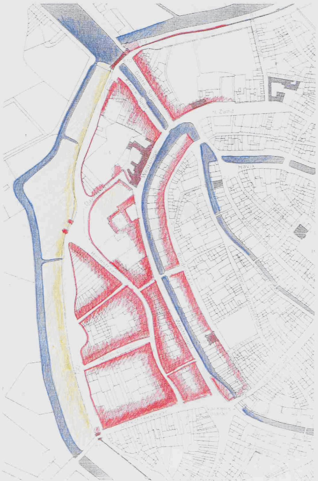
5 Historisch stedenbouwkundige studie: situatie 1824