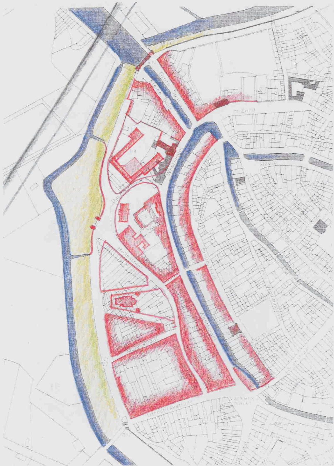
Historisch stedenbouwkundige studie: situatie eerste helft 20 e eeuw