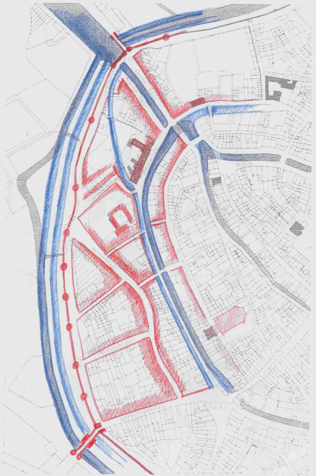
Historisch stedenbouwkundige studie: situatie 16 e eeuw