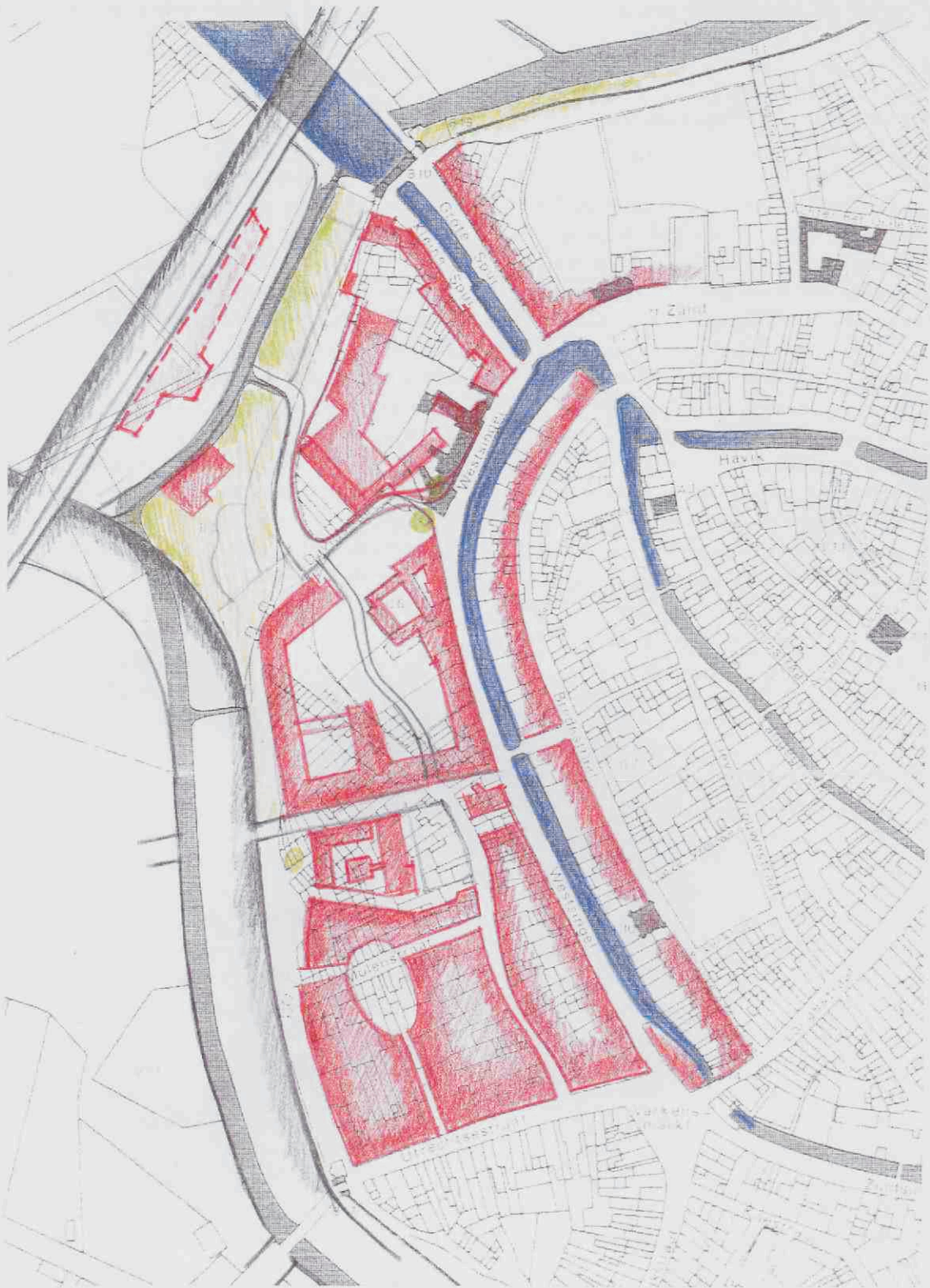
Historisch stedenbouwkundige studie: huidige situatie