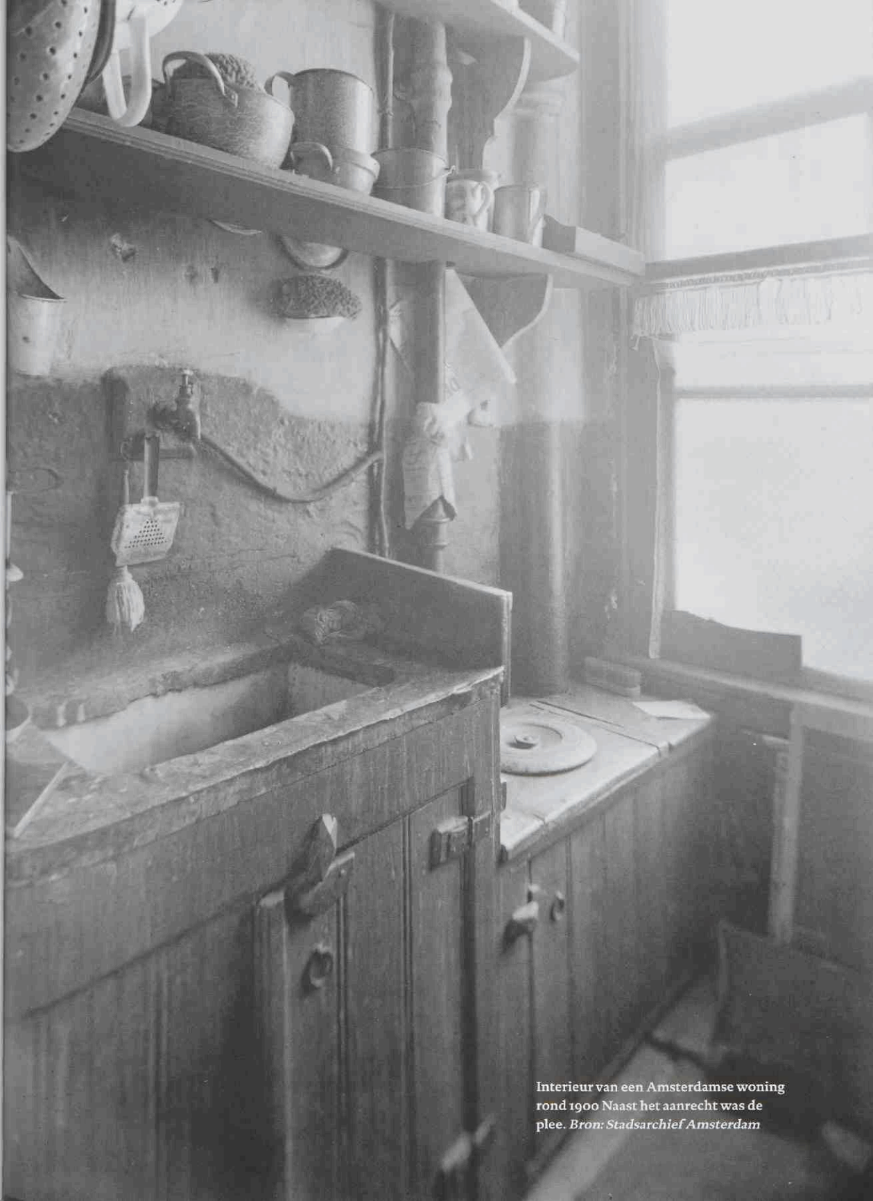
Interieur van een Amsterdamse woning rond 1900 Naast het aanrecht was de plee.