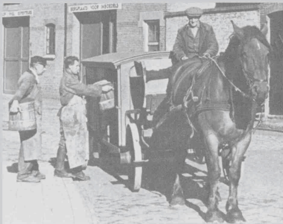
Tonnenophaal met de 'Baldoot-kar' in de Koestraat