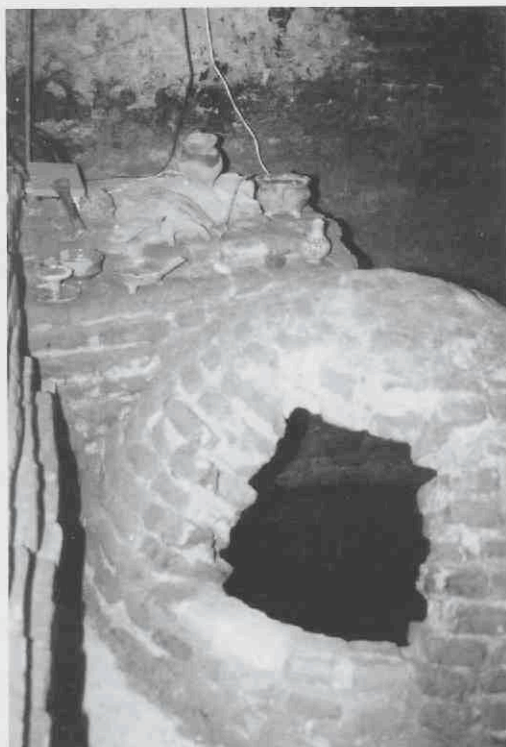
Inpandige beerput in Muurhuizen 179.

Beerputten op de hogere zandgronden kennen geen bodem, maar staan direct op het zand. Sommige beerputten hebben een constructie waarbij het onderste deel bestaat uit losgestapelde stenen, waardoor de natte fractie nog makkelijker in de bodem kan weggelopen zodat het uiteindelijke volume vermindert. De put was afgesloten met een gemetselde koepel om de stankoverlast zoveel mogelijk tegen te gaan. Om die reden was ook achter op het erf een veel voorkomende plaats voor een beerput. Het eigenlijke secreet stond erbovenop of vlak naast en was door middel van een gemetselde glijgoot daarmee verbonden. Soms zijn ook binnenshuis beerputten aangelegd. Blijkbaar woog het gemak van een inpandig toilet op tegen de geur ervan. Illustratief is in dit geval een transportakte uit 1561, waarbij een huis in de Langestraat bij een verkoop wordt gescheiden in een voor- en een achterhuis, met dien verstande dat het privaat bij het voorste deel zal blijven