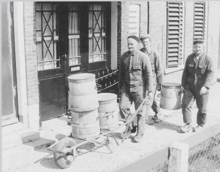
De laatste tonnenrit in Hallum, Friesland, tweede helft 20 e eeuw. Ook in Amersfoort heeft het verschijnsel beerton nog tot in de jaren vijftig bestaan.