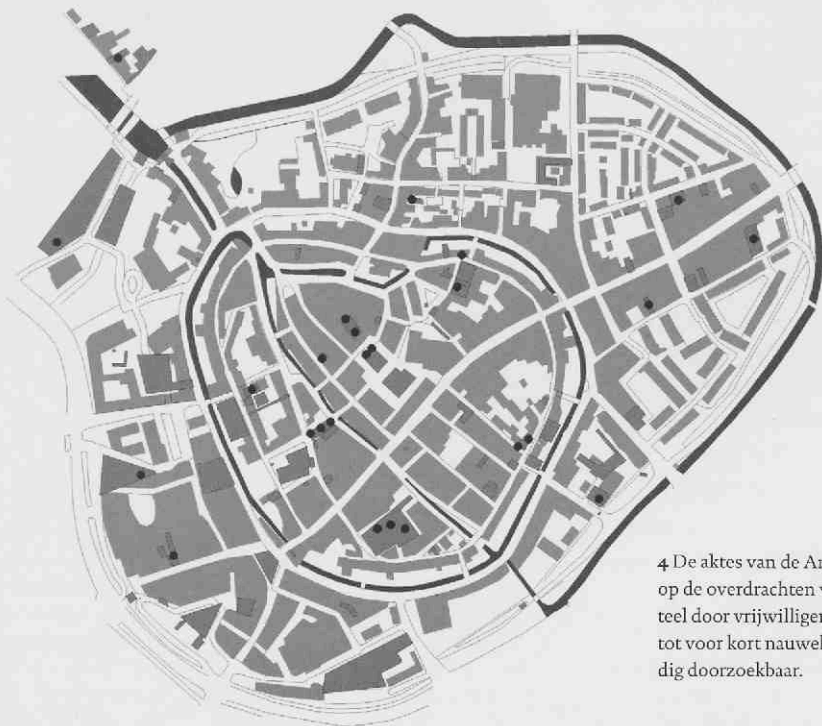
Verspreiding van de beerputten.

teren' wilde. De afmeting van de beerkelders is zo'n 200 x 250 cm; zij werden afgedicht met een gemetseld tongewelf.