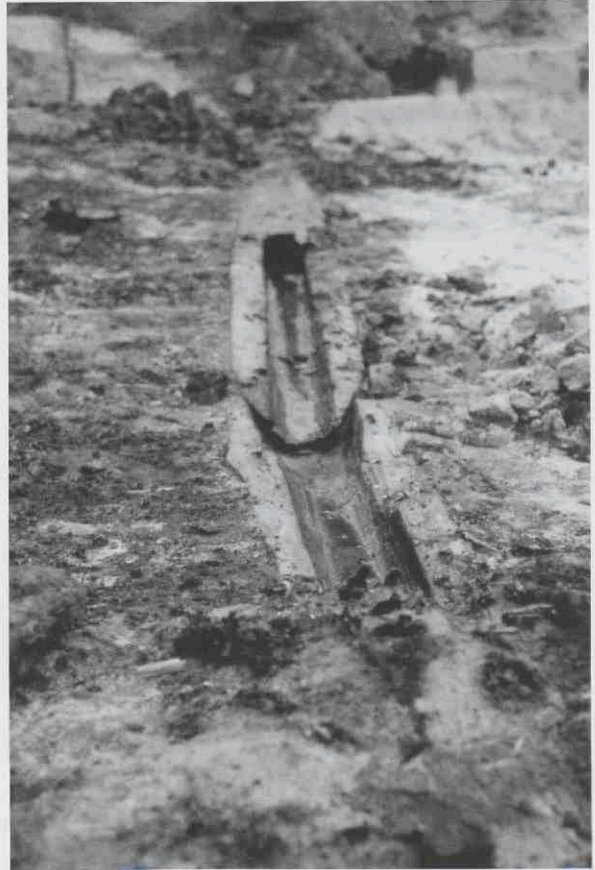
Houten waterleiding bij de Zwanehalsteeg, waarmee water uit de Langegracht werd ingelaten.

Binnen de eerste ring van de stad was de bebouwing sterk geconcentreerd. Het gevolg was een hoge bevolkingsdruk. In de 15 e eeuw vinden we voor de eerste maal besluiten van het stadsbestuur die te maken hebben met het schoonhou-