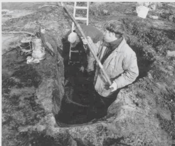
Opgraven van een grote afvalkuil uit de 15 e eeuw met diameter van bijna 3 m en een diepte van 1.20 m. Deze heeft een gelaagdheid, ten teken dat er gedurende geruime tijd afval in is gegooid. De vulling bestond uit bouwafval, bot, metaal en aardewerk.

Beerputten werden in het verleden niet alleen gebruikt voor de opvang urine en fecaliën, maar waren ook een afvaldump voor allerlei huishoudelijk afval. Ondanks het feit dat voorwerpen met reden zijn weggegooid, bijvoorbeeld als ze versleten of gebroken zijn, worden ze nogal eens min of meer volledig teruggevonden. Daar komt nog bij dat niet alleen glas en keramisch afval, maar ook afval van voedselbereiding en -consumptie in de beerput terecht kunnen komen. Zo kunnen botanische resten in de vorm van pitten en zaden en zoölogische resten (graten en botten) informatie geven over dieet en eetgewoonten. Beerputten zijn geruime tijd in gebruik voordat ze vol raken en geleegd moeten worden. Als ze echter niet geleegd worden, maar eenvoudig buiten gebruik worden gesteld, is er dus een 'opname' in de bodem aanwezig van het afvalpatroon gedurende langere tijd. In ideale toestand kunnen we die opname 'afspelen' en zelfs diverse lagen onderscheiden, waaraan verschillende dateringen kunnen worden toegekend. Geen wonder dus dat