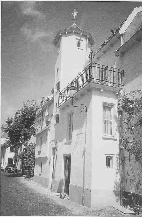
De gevel van Muurhuizen 33 na de restauratie.

"zichtbaar" gemaakt. In een later stadium zal er over dit onderzoek uitvoeriger worden gepubliceerd.