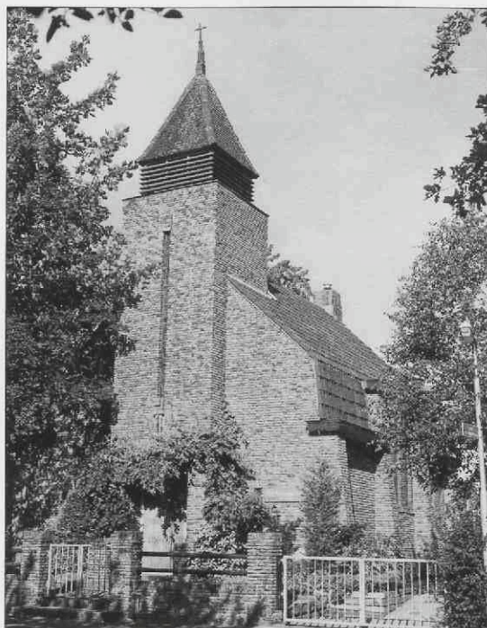
Kerk van de Vrije Evangelische Gemeente, Appelweg 15

Op de grens van de voormalige Juliana van Stolbergkazerne en het Bergkwartier ligt dit bijzondere kerkje aan een oude uitvalsweg van de stad, de Appelweg. De kerk is in 1927 gebouwd naar ontwerp van G. van Hoogevest in de stijl van de Amsterdamse School. Vorig jaar zijn diverse herstel-