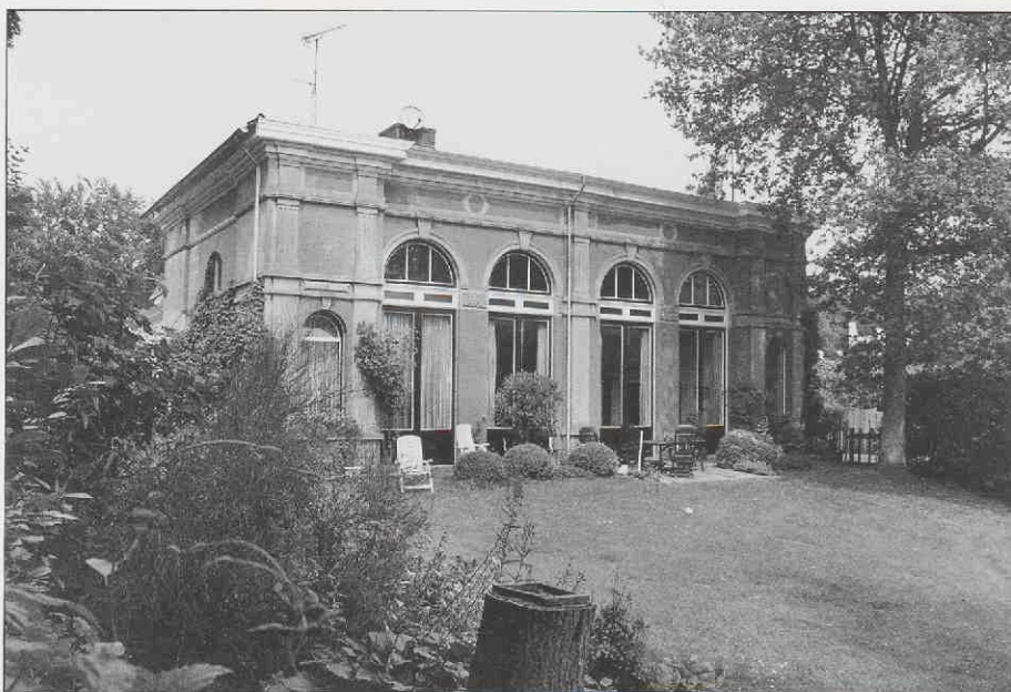
Oranjerie landgoed Nimmerdor vóór restauratie

In een lommerrijke omgeving, gelegen aan een fraaie waterpartij op het landgoed Nimmerdor, staat de oranjerie van dit landgoed. Het is in de late 19de eeuw gebouwd in neoclassicistische stijl. Al sinds vele jaren is de