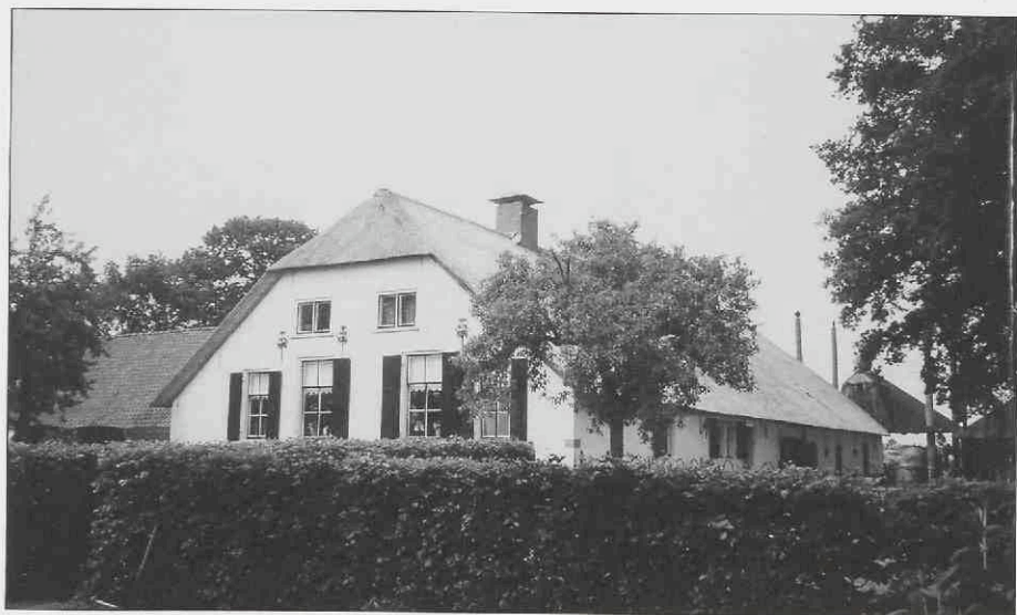
Boerderij Hoogerhorst in Hooglanderveen dateert uit 1699

2003 was uitgeroepen tot het "jaar van de boerderij". Vandaar dat op verschillende momenten aandacht aan deze categorie panden is besteed. In Amersfoort bestond behoefte aan een overzicht van de nog bestaande boerderijen op Amersfoorts grondgebied. Hoewel de algemene opvatting was dat de meeste boerderijen uit Amersfoort hadden plaatsgemaakt voor nieuwe wijken, werd toch aan de Stichting Historisch Boerderij Onderzoek (SHBO) te Arnhem gevraagd een grondige inventarisatie te verrichten. Dit onderzoek werd uitgevoerd door de architectuurhistorici