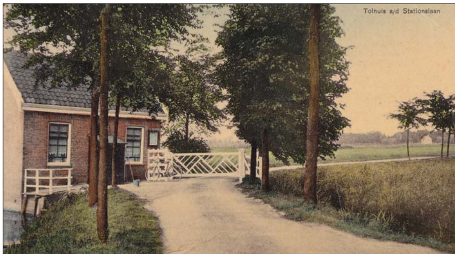
In 1807 werd de Vreelandse laan aangelegd, later Spoorlaan geheten omdat deze naar het in 1854 gebouwde station Loenen-Vreeland liep.

stuk is een verklaring, waarin alle lidmaten van de lutherse gemeente, woonachtig in Vreeland (zo'n dertig in getal), afstand deden van de aanspraken op het hervormd kerkgebouw en deze geheel overgaven aan de Hervormde Gemeente van Vreeland. 6)