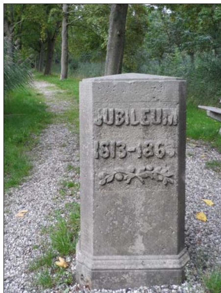
Het monument aan de zuidzijde van het Jubileumlaantje.

Na de inlijving bij het Franse keizerrijk kwam er opnieuw een departementale herindeling. Het departement Utrecht verdween en Vreeland, net als andere gemeenten in de Vechtstreek, maakte vanaf dat moment deel uit van het departement van de Zuiderzee, met als hoofdstad Amsterdam. In 1811 werd bestuur