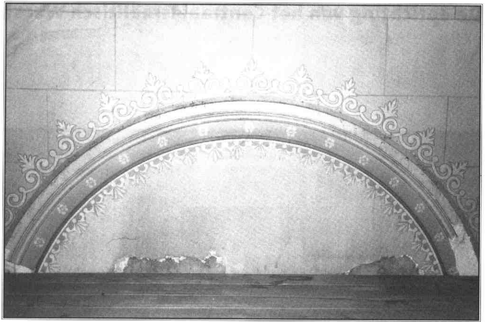
Foto van het plafond van de Synagoge gemaakt na 'herontdekking' van de ruimte.

als de argumenten tegen gestichtsverpleging het niet meer zo goed doen, schakelt hij over op de negatieve kanten van de stad Utrecht, terwijl hij tenslotte maar accepteert dat er een instelling moet komen, maar dan wel versnipperd in de provincies. Alles bij elkaar ontstaat toch de indruk dat enig eigenbelang hier zeker niet afwezig was: het zou immers kunnen gaan om een concurrent, die wellicht een aanzuigende werking zou krijgen op de beschikbare geldstromen. Ook in de 19e eeuw bestond er immers een soort van liefdadigheids- markt, die bewerkt moest worden.