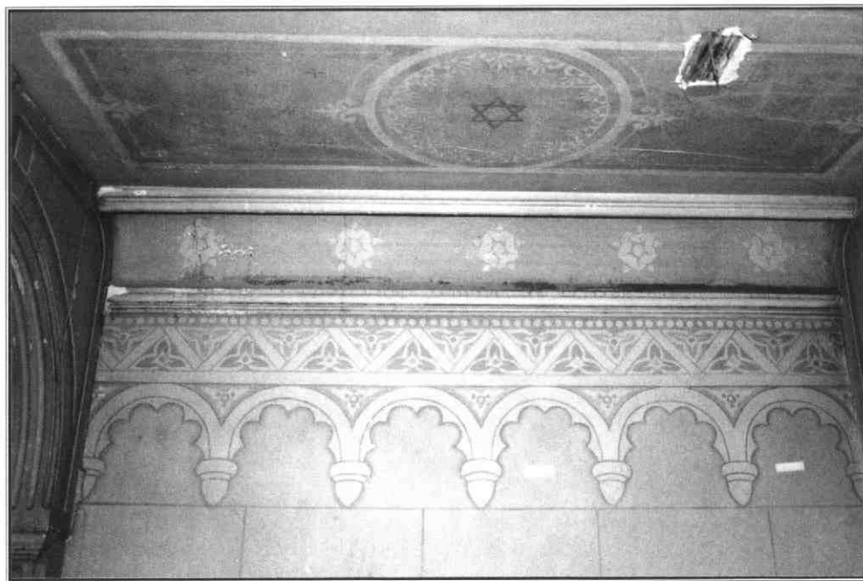
Foto van het plafond van de Synagoge gemaakt na 'herontdekking' van de ruimte.

zaamheid en onoppassendheid. Soms werden kinderen genadeloos uitgebuit. In reactie op dit 'assepoester-syndroom' werd in 1836 in Amsterdam het eerste joodse weeshuis voor jongens geopend. Dit voorbeeld werd gevolgd: eind 19e eeuw vormden vier Amsterdamse joodse weeshuizen, samen met weeshuizen in Leiden, Rotterdam, Den Haag en het C.I.W. in Utrecht de kern van de joodse wezenzorg in Nederland. Aan uitbesteding van weeskinderen is echter nooit een einde gekomen. Voor een deel had dit te maken met een gebrek aan opvangmogelijkheden, maar ook met veranderende opvattingen over wezenzorg, zoals we later zullen zien.