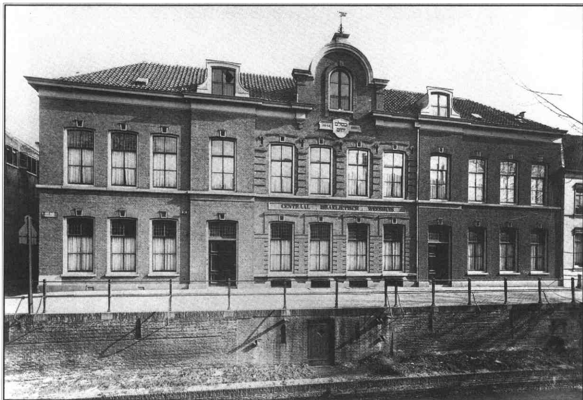
Gezicht op de voorgevel van het weeshuis, 1932.

ramp op ramp getroffen, aan jammer en lijden overgegeven, van rijke verwanten vervreemd, van machtige vrienden verlaten, aan niemand openhartig zijn nood durft klagen, aan niemand Zijne behoeften vertrouwelijk durft blootleggen, dat hulpeloos en eenzaam, zonder steun en zonder stut, zonder leidsman en raadgever in de wereld staat, dan kan men dit niet treffender doen, dan onder het beeld van een wees! 4 Zoals in die tijd gebruikelijk werd de brochure via advertenties in de joodse pers onder de aandacht van het publiek gebracht. Zo werd geadverteerd in het Weekblad voor Israëlieten van 27 oktober 1865. Zowel deze redactie als de redactie van het Nieuw Israëlitisch Weekblad zouden zich steeds een groot voorstander van de Utrechtse zaak tonen. De advertentie was voor de redactie van het Weekblad voor Israëlieten de aanleiding om zich achter het initiatief te stellen. Hiermee werd de discussie verplaatst naar het publieke domein.