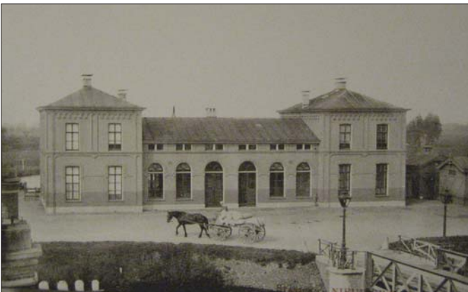
Hendrik Jan Doude van Troostwijk verkocht in 1842 grond aan de Staat voor de aanleg van de spoorweg. Hij bedong voor de inwoners van Nieuwersluis dat alle treinen in Nieuwersluis zouden stoppen opdat het dorp zich verder kon ontwikkelen. Deze foto toont het station van Nieuwersluis, met een klein deel van de brug over het toenmalige Merwedekanaal. Het stoppen van de treinen is pas in 1953 door de Staat afgekocht, waarna het station snel werd gesloopt. De draaibrug en de loopbrug waren al veel eerder verdwenen en vervangen door een pont.

Eén van de bosknechten droeg tijdens het werk altijd een streepjesbroek van een jac-