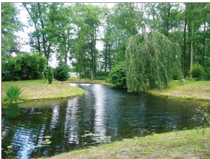
Een prachtig doorkijkje over de vijver met (links) het eiland en rechts de verkleinde treurbeuk.