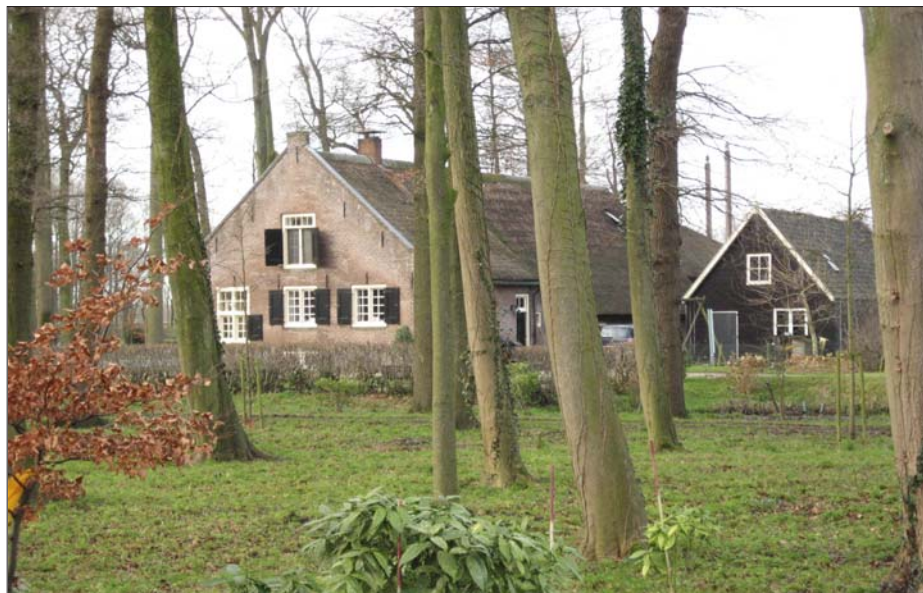
De Hofstede Sterreschans, Rijksstraatweg 7, Nieuwersluis, gezien vanaf de zijde van de Rijksstraatweg.

De schade was enorm. De bezetter wilde de voormalige eiken/kastanjelaan (voorheen de overplaats van Rupelmonde) als vrij schootsveld vanuit het Fort. Daar stonden eiken welke om die reden geveld