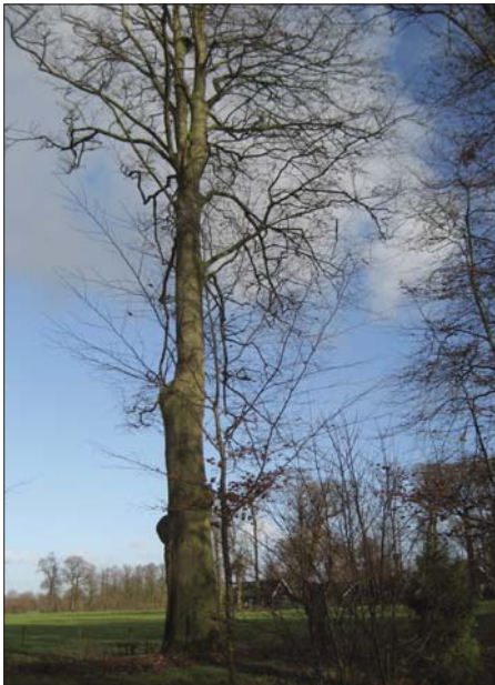
De oudste beuk in het park (op de achtergrond ligt de Hofstede), op sterven na dood.

Junior wijst op de noodzaak om vooral ook praktisch te blijven. Vroeger kostte een tuinman weinig; nu ruim 40 euro per uur. Dus proberen vader en hij veel werk zelf te doen met hulp van enkele vrienden. Werk waar ze niet aan toekomen wordt uitbesteed, denk aan het overgrote deel van het maaiwerk. Bepaalde zaken moet je anders organiseren dan vroeger. Beplanting vlak langs sloten wordt verplaatst opdat je er met een machine langs kunt rijden. Waar tot voor kort bijvoorbeeld het handmatig maaien van de sloot langs de notenboomgaard minstens vier