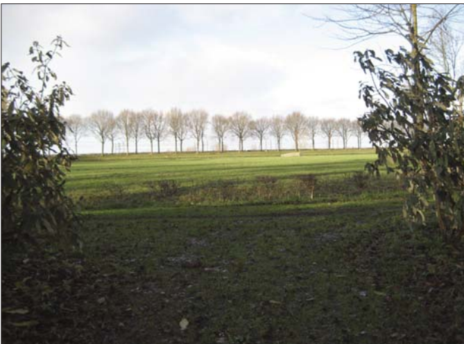
Zicht vanaf de Hofstede over de weilanden naar het Amsterdam-Rijnkanaal met de bomenrij op de Oostkanaaldijk. Vóór de kanaalverbreding in 1942 lag daar een prachtige Eikenlaan welke de weilanden omringde.

Tulpenbomen worden zeer oud en zullen later, als zijn nazaten het beheer voeren, zeer geschikt zijn voor de fabricage van houtfinezier. In het landgoed wordt geen bemesting toegepast. Wél hout-snipperers maar dan in een dunne laag (een te dikke laag maakt de grond zuurstofarm). Alle versnipperde houtresten worden binnen het landgoed verwerkt, opdat zich een humuslaag vormt.