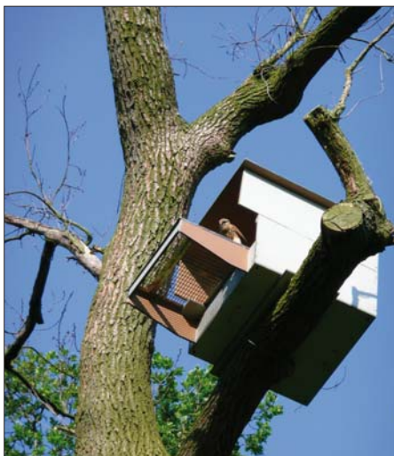
Een van de valkenkasten, met bewoner.

Iedereen kan hier vrij wandelen, entree heffen heeft voor ons geen zin. Volgens de Natuurschoonwet mag je maximaal € 2,50 entree vragen, maar iemand bij de ingang neerzetten is voor zo'n klein bedrag niet rendabel. Daar komen te weinig mensen voor. Op de lanen mag alleen worden gewandeld van zonsopgang tot zonsondergang en dat geldt alleen voor het park. Buiten de lanen is het verboden toegang. De hofstede met weilanden zijn niet voor het publiek toegankelijk. Men kan een rondwandeling maken vanaf de Straatweg, via de Hobbelaan door het park, bij het hek naar de Oost-kanaaldijk eruit, dan via de kanaaldijk naar de Nieuwe Wetering en langs die wetering om het fort