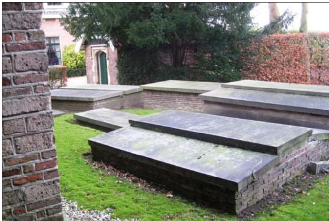
Grafstenen van de familie Doude van Troostwijk op het kerkhof van Nieuwerter Aa.

Junior, die soms in de bomen klimt om takken af te zagen en om zo nodig de toppen eruit te halen, ontdekte dat de bast van de oude eik aan de kant van de vijver helemaal los zat. De deskundigen zijn verdeeld over te nemen maatregelen, maar