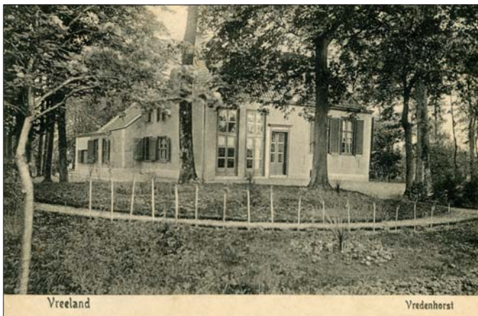
Vreedenhorst in ca. 1907, voor de verhoging van het huis

zand, afgedekt met hier en daar slechts een dun laagje veen. Aannemelijk is dat het land achter het huis is afgeticheld. Voor het huis ligt onder het gras namelijk een veld van 40 x 40 meter van twee lagen ongebakken kloostermoppen. Wellicht zijn hier halverwege de 13 de eeuw de stenen gewonnen en gebakken om het voormalige kasteel Vredeland mee te bouwen, dat immers nog geen kilometer zuidwaarts lag, aan de overzijde van de polder. Ook andere vondsten, zoals een 13 de eeuwse vuurdoover, misbakfels en potscherven, duiden op de aanwezigheid van bewoning vanaf die periode.