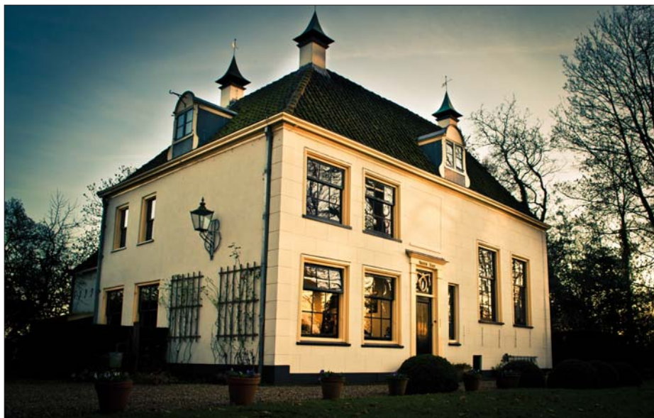
Vreedenhorst nu

Vreedenhorst is gelegen aan de Vecht in de Dorssewaardpolder. Deze polder van 130 hectare wordt begrensd door de Vecht, de Kleizuwe en de Gabrielweg en is een van