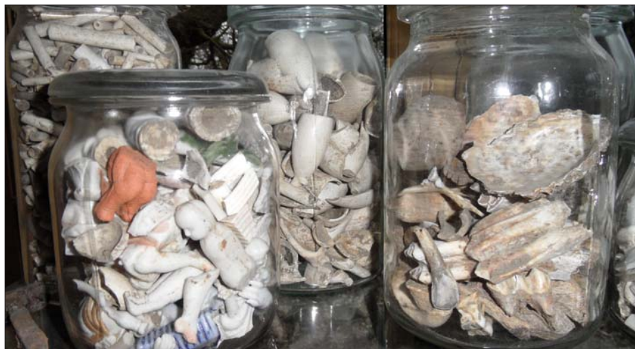
Selectie van de vele potten met in de tuin opgegraven voorwerpen, zoals pijpenkoppen, oesterschelpen, servieerscherven (met naam en logo van het Krasnapolskhotel in Amsterdam!) etc.

met 6 morgen land en hield zelf 21 morgen. De heren stichtten in bijgebouwen naast het hoofdhuis een koperkatoendrukkerij. 2) Hier werden zitten stoffen gemaakt volgens een geheim procedé dat angstvallig bewaakt werd. Een gracht werd om het huis gegraven en hoge bomen werden geplant om inbrekers en pottenkijkers te weren en alle werknemers moesten een eed van geheimhouding tekenen bij de schout en schepenen van Vreeland. Leuk detail is dat een van de stofontwerpers ook voor Loosdrechtse porseleinfabriek van dominee Mol werkte. 3) Een steen om de pigmenten te malen is in 1987 opgegraven en nu nog te zien.