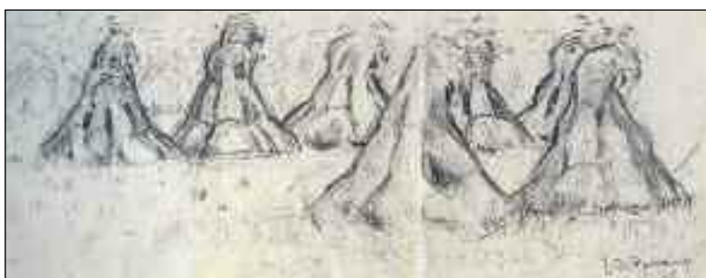
Drempel. Potlood, 1915.