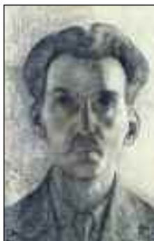
Zelfportret. Potlood, circa 1940.