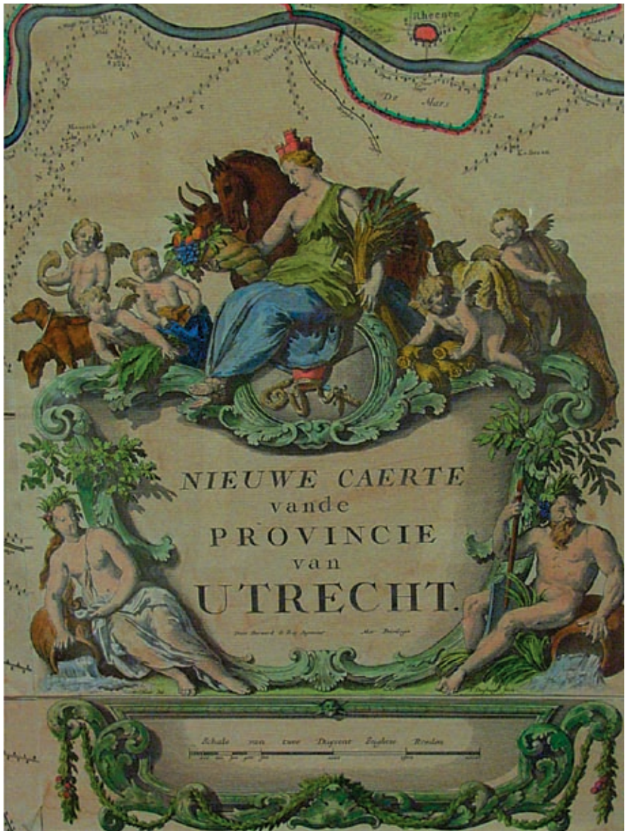
De twee typen cartouches van de kaart van Utrecht van B. de Roij; links die van de eerste druk uit 1696, rechts die zoals voorkomt op de kaarten die gedrukt zijn door Covens en Mortier vanaf 1743.