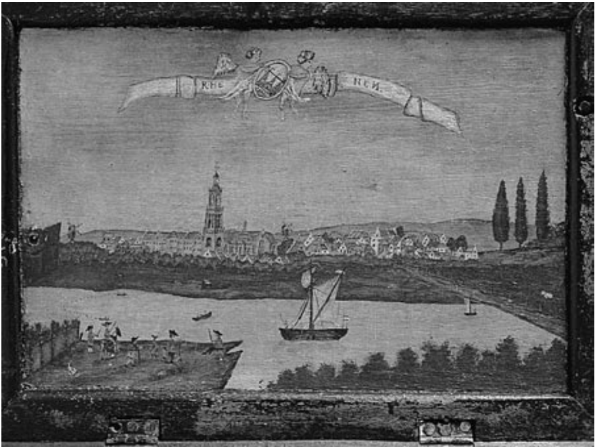
Primitieve schildering, Gezicht op Rhenen (einde 18 e eeuw) aan de binnenkant van de deksel van het 'maire kistje' dat in 2003 uit een nalatenschap van de familie Schimmelpenninck kon worden aangekocht; het tafereel is vermoedelijk nageschilderd van de originele kopergravure van Th. Van Doesburgh van ca. 1700 (Collectie Museum Het Rondeel te Rhenen).