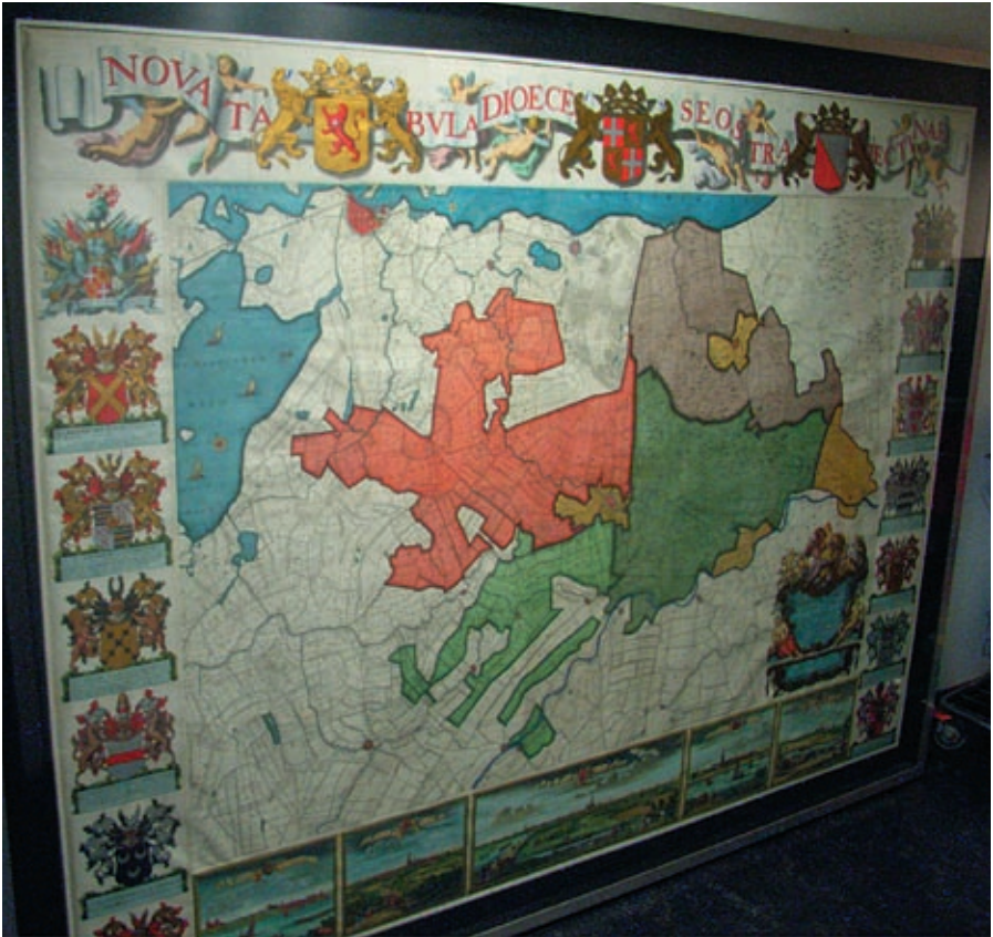
Boven: De volledig gemonteerde en later ingekleurde kaart van B. de Roij, compleet met randversiering; dit is de Covens en Mortier drukversie met een 'Advertentie' in de cartouche (Collectie Topografische Atlas Utrechts Archief).