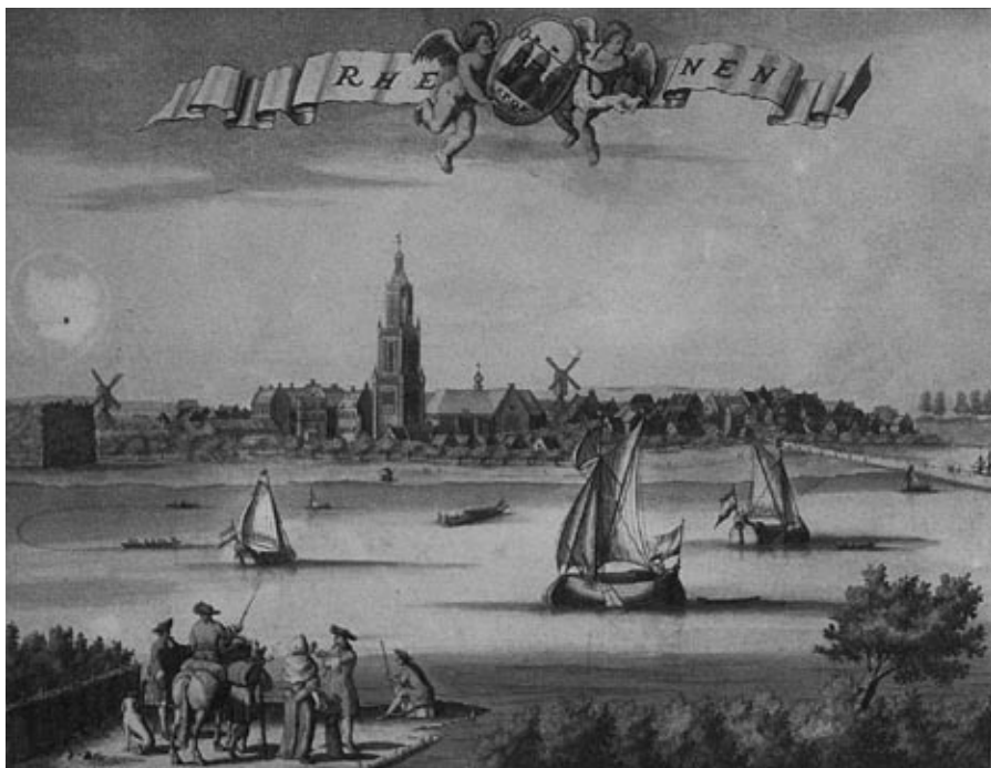
Gezicht op Rhenen, een kopergravure van T. Doesburgh, ca. 1700 (zie Achter Berg en Rijn afb. 49); deze maakt onderdeel uit van de randversiering van de Kaart van den Lande van Utrecht van B. de Roij (collectie familie de Jong).

Hierop komen aanzichten ('prospecten') van de vijf steden van het Sticht voor, t.w. Amersfoort, Montfoort, Rhenen, Utrecht en Wijk bij Duurstede. Alle stedengravures zijn van de hand van Thomas (van) Doesburgh (1677-1714). De koper gravure van Utrecht meet 585 x 225 mm, de overige vier 280 x 225 mm.