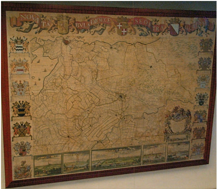
Volledig gemonteerde Kaart van den Lande van Utrecht, met randversiering, gedrukt bij Covens en Mortier te Amsterdam in 1743. Deze kaart hangt in de etalage van Antiquariaat De Slegte aan de Oude Gracht te Utrecht.