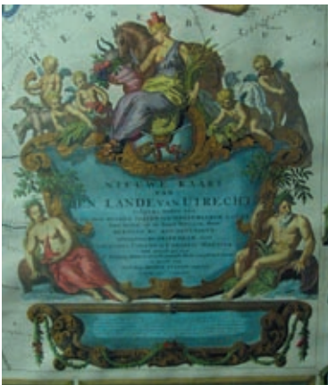
Links: De cartouche van de ingekleurde kaart van de Roij, aanwezig in het Utrechts Archief. Door de donkere steunkleur is de tekst moeilijker te lezen.