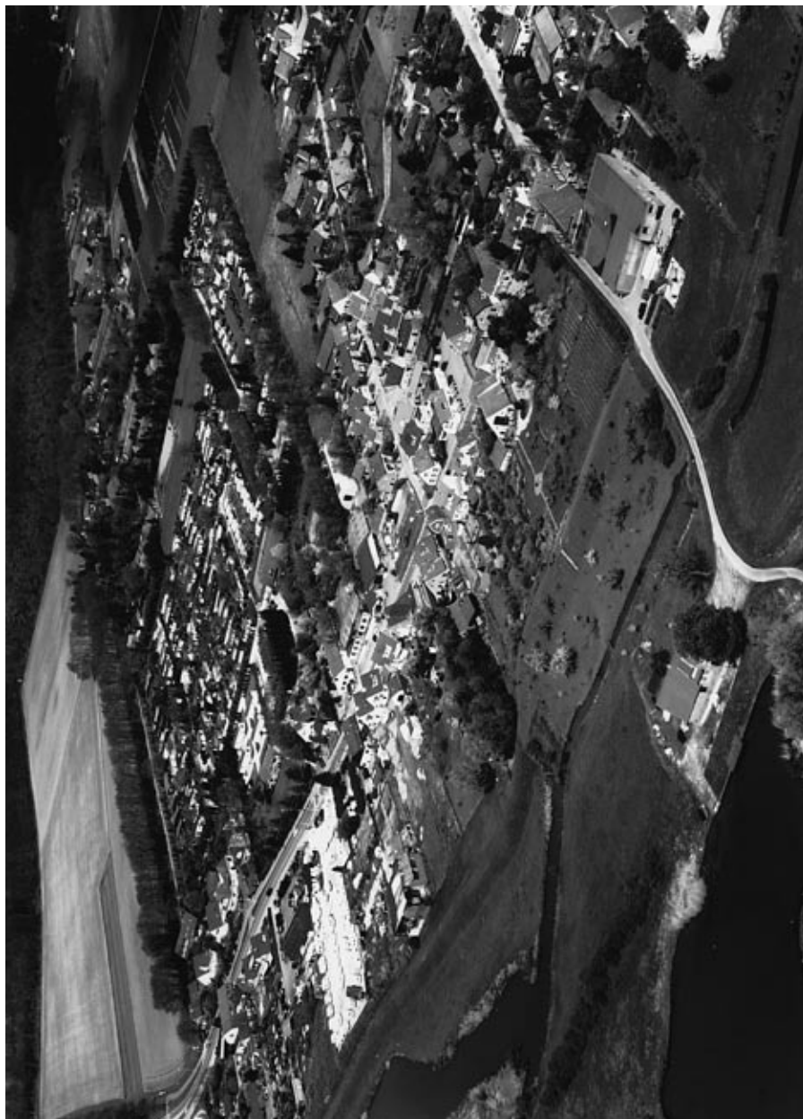
Een luchtfoto van een gedeelte van het voormalige Elst-Amerongen