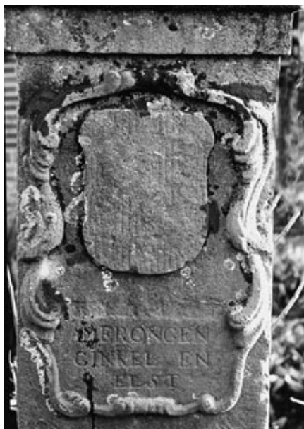
De grenspalen in Elst, ten noorden van de Bosweg, hoek Vissersweg/Utrechtse straatweg, Molenweg 4.

zou dit de particuliere eigenaars te veel benadelen, het verzoek werd daarom per Koninklijk Besluit afgewezen