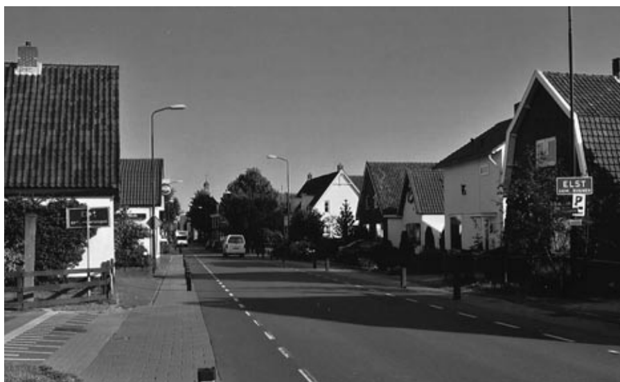
De borden links en rechts van de weg zijn vanaf 1 januari 2006 overbodig