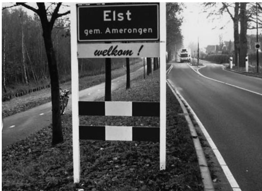
Ook als het Elst gemeente Rhenen is zal men er welkom zijn.