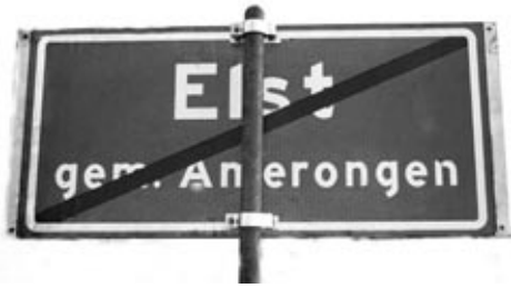
Een plaatsnaamaanduiding die we niet meer zullen zien.

Op 13 september 2005 heeft de Eerste Kamer in het kader van een gemeentelijke herindeling in zuid-oost Utrecht (samenvoeging van de gemeenten Amerongen, Doorn, Maarn, Leersum en Driebergen) onder meer besloten tot een grenscorrectie tussen de gemeentes Rhenen en (de voormalige gemeente) Amerongen. Dit betekende dat per 1 januari