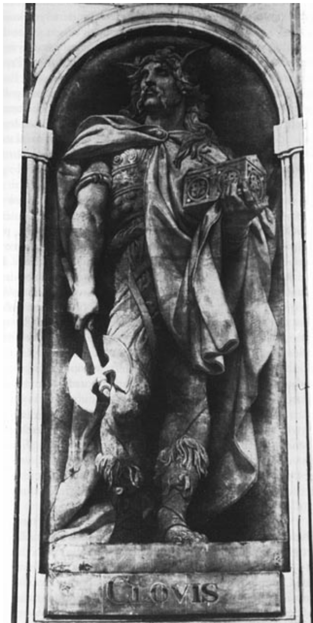
Koning Clovis volgens een 19e-eeuwse zienswijze (Uit: James, De Franken, blz. 91)