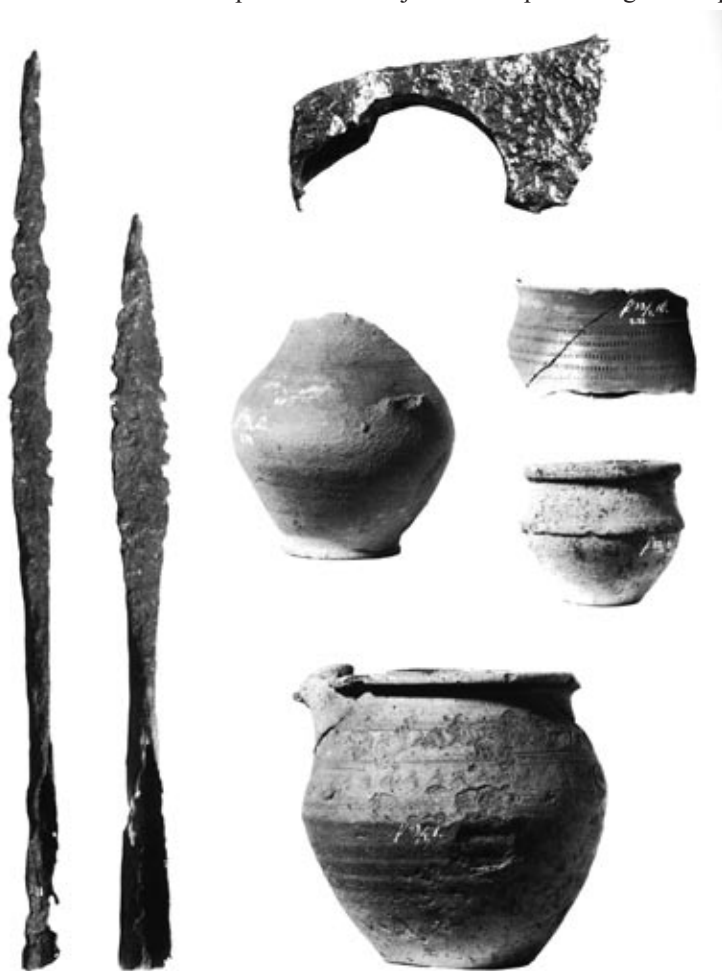
Voorwerpen uit het Frankische grafveld van de Laarsenberg, 6e en 7e eeuw (Uit: Besteman e.a., Medieval Archaeology in the Netherlands, blz. 22)

maar vooral bij Apeldoorn. enorme hoeveelheden ijzerslakken bevonden. Verder onderzoek toonde aan dat er op de stuwwallen massa's klapperstenen lagen. Een klappersteen bevat een hoeveelheid ijzererts die zich rond een kleine kern concentreert. Als door krimp deze kern zich van de buitenwand losmaakt, kun je deze steen bij schudden horen 'klapperen'. Door verhitting met houtskool wonnen de vroege middeleeuwen ijzererts dat vervolgens tot wapens en gereedschap werd omgesmeed. IJzeruitvoer vond plaats via de Rijn. Deze export was gericht op Wijk