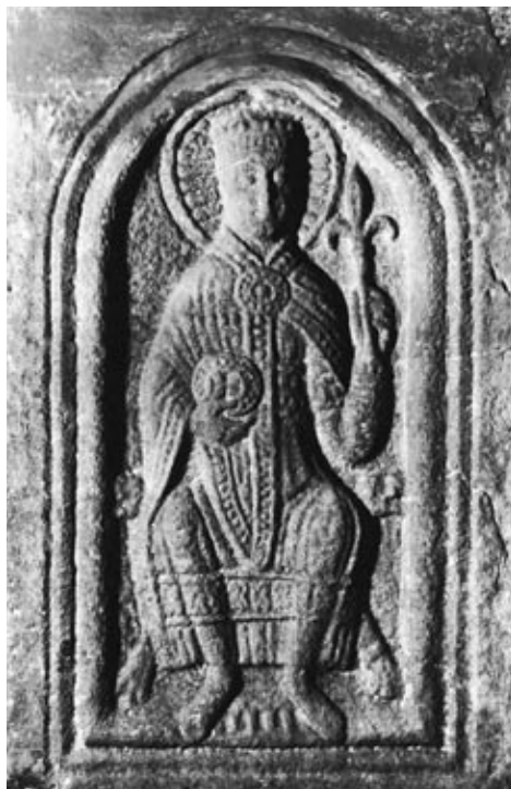
Reliëf met afbeelding van Pippijn de Korte (Uit: Blok, De Franken in Nederland, blz 59)

Naar de eerste majordomus Pippijn werd dit geslacht van erfelijke hofmeiers de Pippiniden genoemd. Diens nazaat Pippijn III was iemand die een kleine gestalte aan een helder verstand paarde. Naar de eerstgenoemde eigenschap werd hij in de geschiedenis als Pippijn de Korte bekend. Op een gegeven moment vroeg deze majordomus zich af wie nu eigenlijk de titel koning der Franken verdiende, hij die in naam de macht had of hij die de macht in werkelijkheid uitoefende. Hij stelde