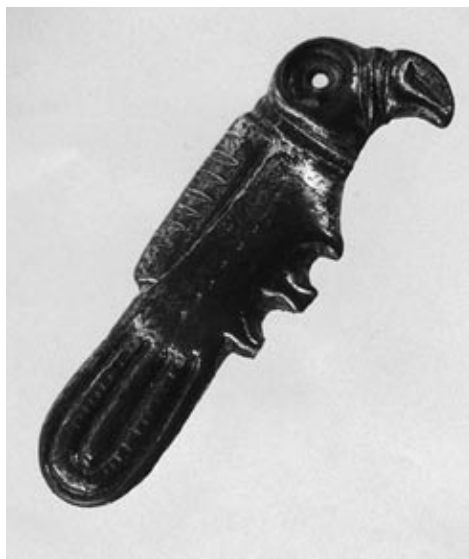
Vogelfibula uit het Frankische grafveld van Rhenen (Uit: Folder Het Rondeel)

Overigens waren de invallen der Germanen al heel lang vóór het bovengekozen jaartal 500 n.C. begonnen. Reeds rond het jaar 275 overschreden de Franken de Limes, de noordgrens van het Romeinse Rijk, voor de eerste keer. Deze Limes werd over honderden kilometers gevormd door de Rijn, een bewust gekozen natuurlijke grens, die in de Romeinse nadagen nauwelijks een beletsel vormde voor de hordes Germanen die likkebaardend uitkeken naar de vele rijkdommen die de streken aan gene zijde van de Rijn hun beloofden.