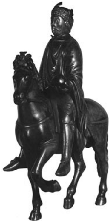
Ruiterstandbeeld van Karel de Grote uit omstreeks 860 (Uit: Blok, De Franken in Nederland, voorzijde omslag)

Het Frankische Rijk was in de eerste plaats een agrarische maatschappij. Geld was er nauwelijks in omloop, handel was ruilhandel en beloningen werden in grond geschonken. Van de vele vernieuwingen hadden om bovengenoemde redenen op zijn minst drie te maken met grond en bodem.