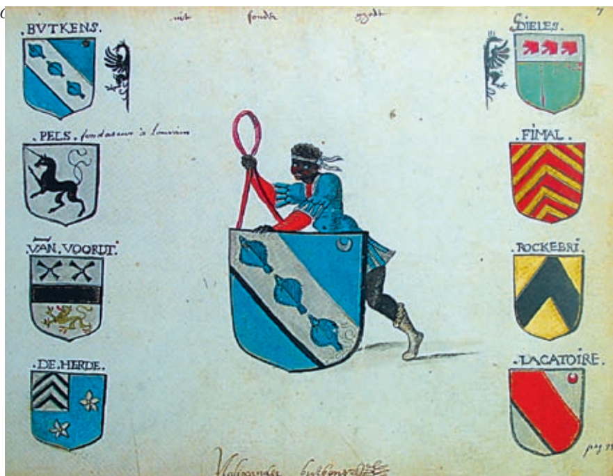
De 8 wapenkwartieren van Alexander Butkens (verzameling VLS Codex CCXXI)