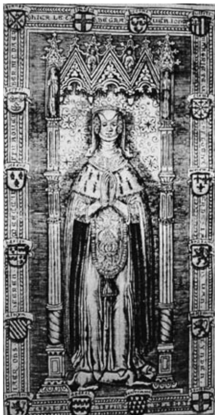
Koperen deksel op het graf van Margriet van Lynden met 16 wapen kwartieren. Dit graf zou zich volgens Butkens hebben bevonden in het Agnietenklooster te Rhenen

verbleef het Agnietenklooster reeds afgebroken was om plaats te maken voor het Koningshuis, een zomerpaleis dat Frederik V van de Palts op die plek liet bouwen. Voorts bevindt zich in Butkens' boek een afbeelding van het kasteel Ter Lede bij Lienden, dat volgens Plomp bij lange na niet zo prachtig was als deze afbeelding deed vermoeden. Zonder Butkens' valse voorstellingen hier te vergoelijken lijkt het