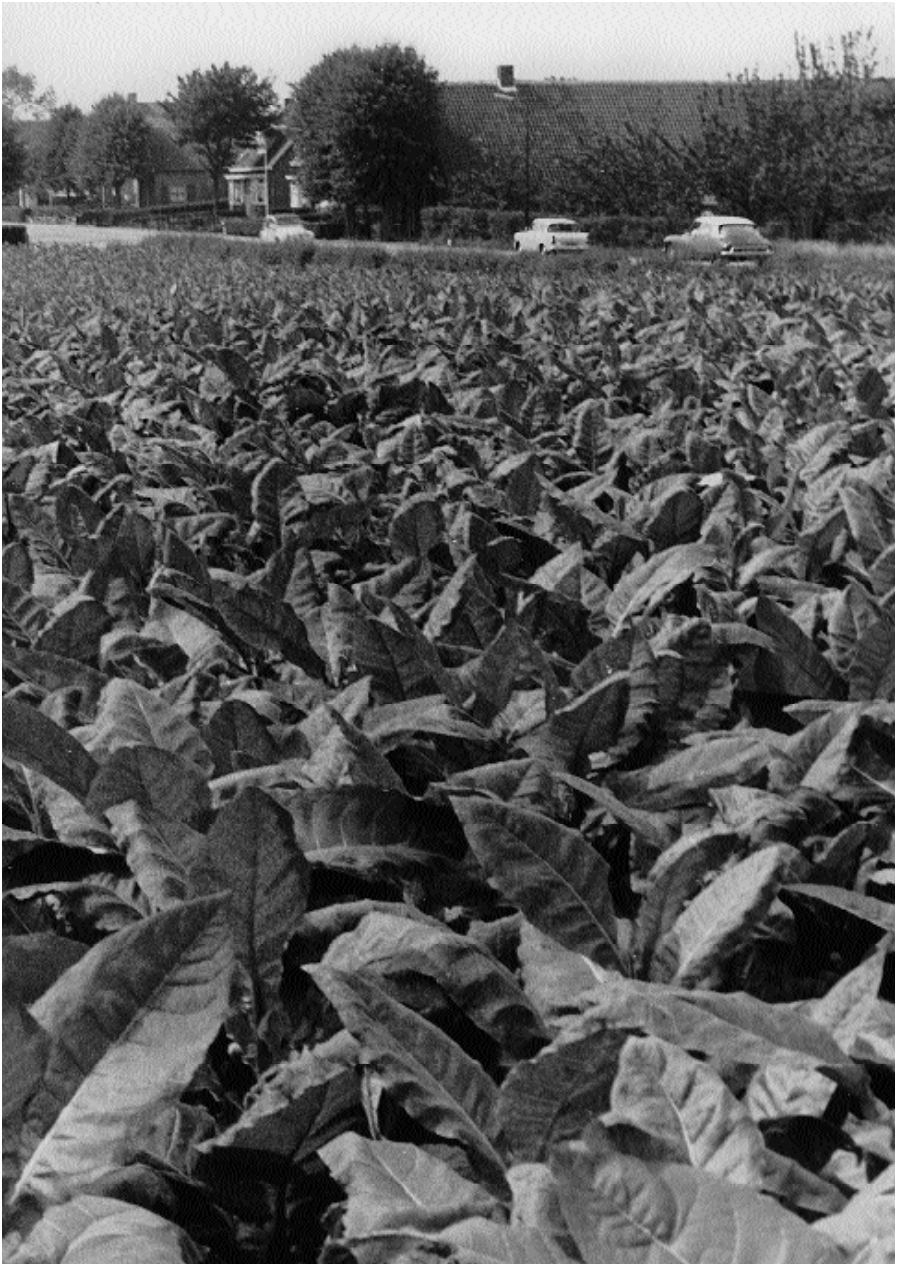
Tabaksveld aan de Rijksstraatweg te Elst(U)