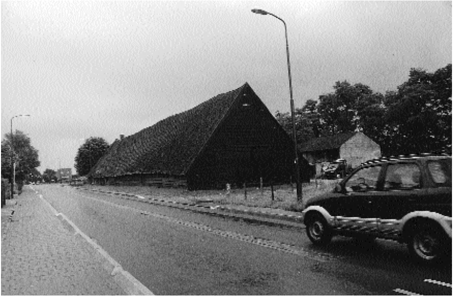
Rijksstraatweg 234, Elst (U)

In het kader van het “Jaar van de Boerderij” een artikel, gewijd aan deze tabaksboerderij in Elst. Bij dit artikel is dankbaar gebruik gemaakt van een “Bouwhistorische verkenning” door de Stichting Historisch Boerderij Onderzoek