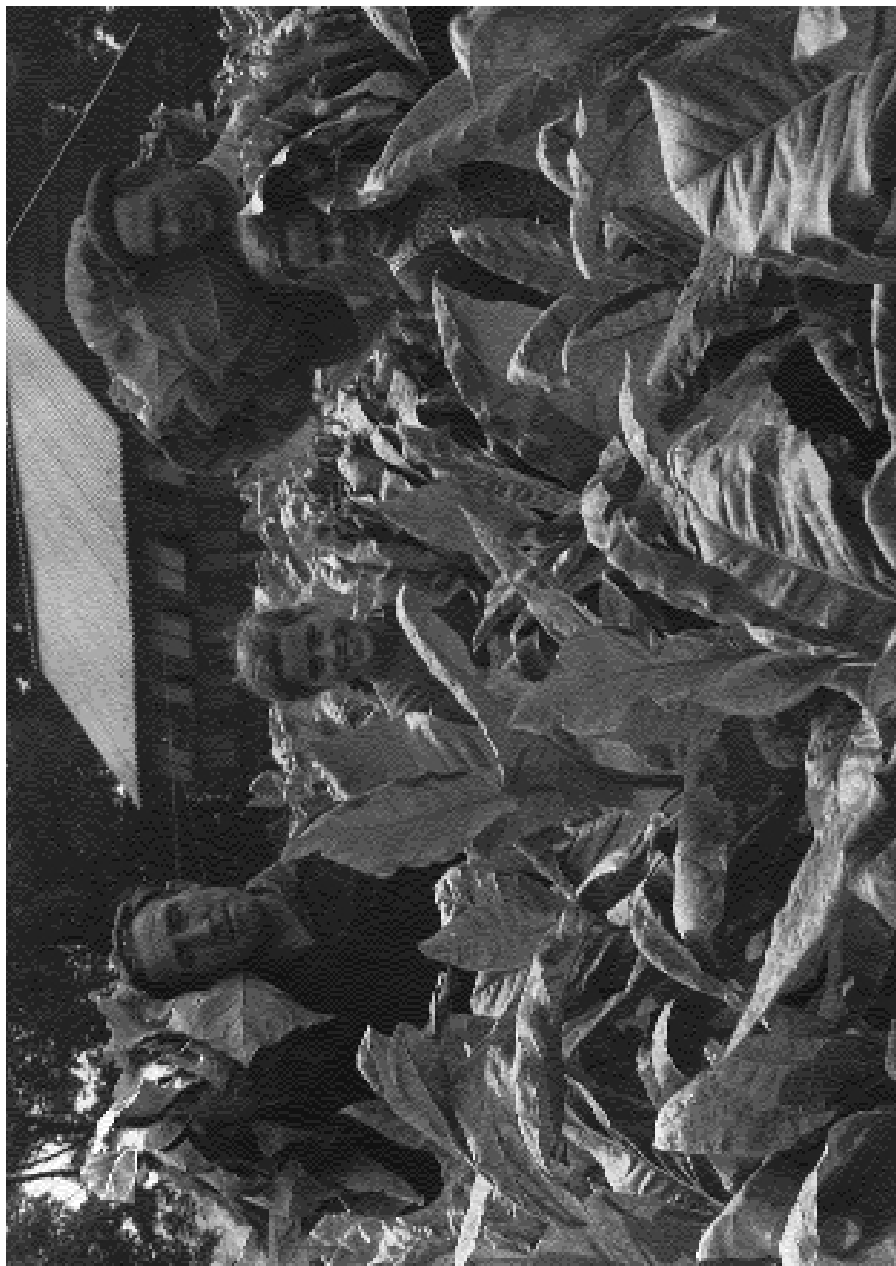
Tabaksoogst aan de Rijksstraatweg in Elst(U) (foto P. Terlouw, 1960)