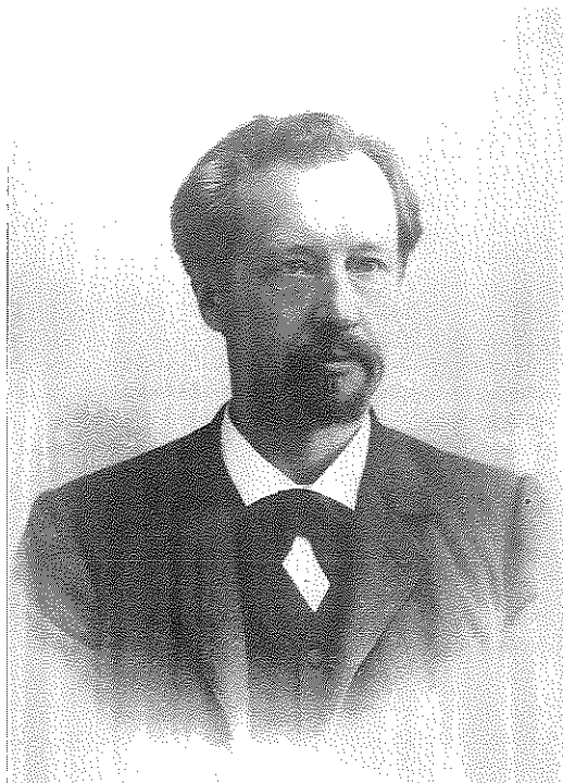
Hugo de Vries