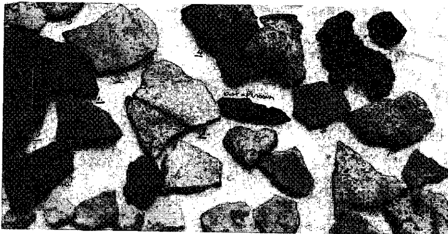
Een overzichtsfoto van de vondsten.

Aan aardewerk werd gevonden: 47 scherven waaronder 6 randjes van 4 verschillende potten, onder andere een dikke scherf met ronde rand. Enkele wandscherven zijn gesinterd, stille getuigen van grote hitte. Opmerkelijk was de scherpe schouderknik van een flinke potscherf, evenals de wandscherf waarop een scherp getrokken, geometrisch motief was aangebracht.