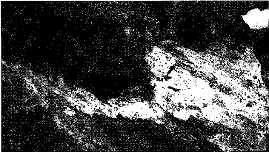
De vondstplek met, ter oriëntatie van de omvang, de troffel ernaast.

Niet ver van de graansilo aan de Cuneraweg trof zij boven in de wand van een nieuwbouwput een donkere baan aarde aan die belangrijk afstak tegen het fijne, geel-witte zand van de drie meter diepe garagekuil.