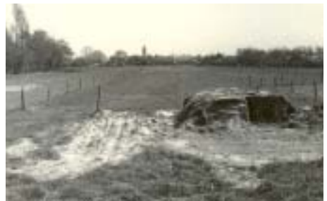
Vanaf het zandpad tussen de akkers tegenover Laarderweg 86c keek je naar de huizen van de Streefoordlaan (nr 2 t/m 20). Links de zuidrand van de Algemene Begraafplaats en rechts de noordrand van het Vierkante Bosje (foto voorjaar 1970: Henk van Hees).