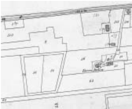
Situatie ca 1870: Vierkante Bosje nog als in 1832; bijna geen bebouwing bij Molenweg.

Vanaf de eerste kadastrale registratie omstreeks 1832 tot aan de aanleg van Rijksweg A27 begin jaren 1970 was het Vierkante Bosje een stukje land met een bijzondere vorm. Op de kaarten valt het op, omdat het anders is dan de lange oost-west lopende smalle stroken grond, die het kenmerk zijn van de meeste landerijen in de gemeente. Van buitenaf gezien was het een bijna vierkante groep bomen, maar daar binnen lagen twee percelen weiland. Dus eigenlijk een stuk weiland, omzoomd door een strook bomen (houtwal). Tot ca 1950 werden de bomen om de paar jaar gekapt en werd het hout verkocht voor ovens van bakkers. Daarna is de houtwal verwilderd, maar werd zo nu en dan wel uitgedund. Er stonden vooral elzen, maar ook eiken. De twee percelen weiland waren gescheiden door een sloot. In het midden daarvan lag een poel met een