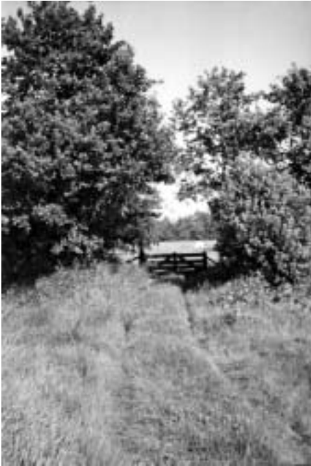
De ingang naar de weilanden, die omzoomd werden door het Vierkante Bosje. Dit is bij de noordwesthoek van het bosje. Ook is het karrenspoor goed te zien.