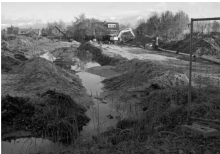
De aanleg van de straat en singeltjes is begonnen. Zicht langs de noordkant van het vroegere bosje naar de huizen Streefoordlaan 16 t/m 24. (Foto: december 2005, Rom van der Schaaf).

komen op het terrein van Ahold en het restje grond van de Hervormde Gemeente Eemnes. Door bezwaren van omwonenden tegen de plaats van de clusterschool, moest het Gemeentebestuur nog een aanpassing doen om een compromis te bereiken. Toen men in het voorjaar van 2005 was begonnen met voorbereidende werkzaamheden en een rij bomen was gekapt, kopte de Gooien Eemlander nog "Kaalslag Vierkante Bosje". Ondanks nog resterende bezwaren startte op 8 september 2005 in Restaurant Eemland de verkoop van 39 eengezinswoningen in de jaren-dertig stijl. Heel veel mensen toonden belangstelling voor de tekeningen en de maquette. De fraaie brochure van het plan toont maar liefst tien verschillende typen, waarvan de prijzen liggen tussen €269.000,- en €695.000,-. Aan de zuidkant, bij de Eemlustlaan, komt ook nog een gebouw voor 16 appartementen, verdeeld over 4 woonlagen. Een klein stuk van de grond bleef eigendom van de kerk, waardoor er achter de huizen Streefoordlaan 14 t/m 18 zes woningen voor senioren komen, die behoren tot de Hervormde Gemeente Eemnes. Die huizen liggen met de voorkant aan de nieuwe straat Vierkante Bosje. Naar verwachting komen de school en de woningen gereed in 2007. De ontwikkelaars van het plan hebben met architect