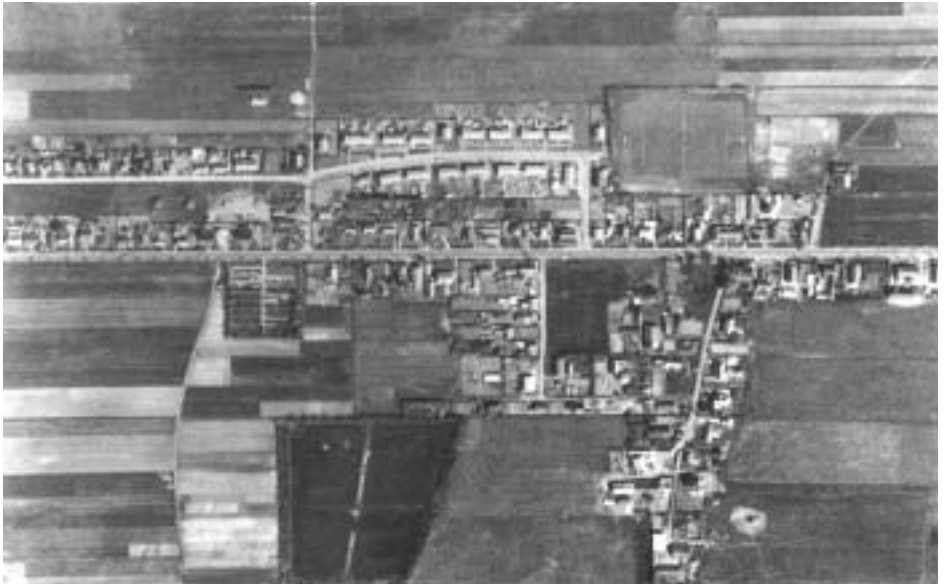
Vierkante Bosje ca 1960, met Molenweg en Veldweg.