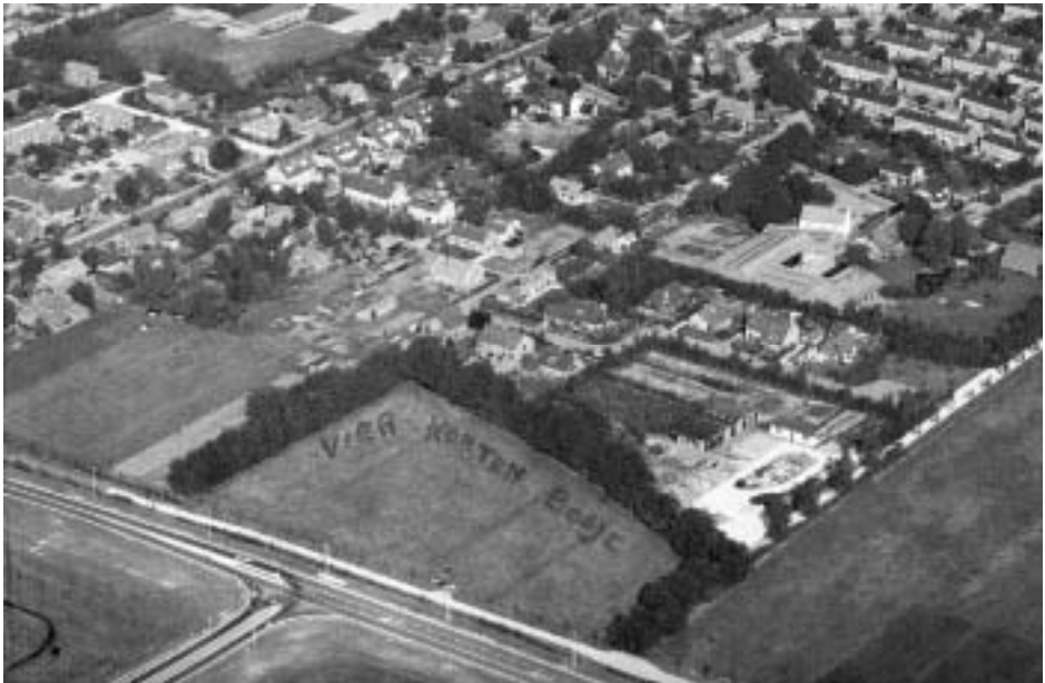
Situatie ca 1978 met rest Vierkante Bosje en omringende gebied. Nog geen Eemlustlaan.