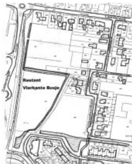
Situatie begin 2005: oost van de Zuidersingel is het oostelijke restant van het Vierkante Bosje nog herkenbaar.