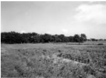
Zuidwestflank Vierkante Bosje; gefotografeerd vanaf het zandpad tussen de akkers tegenover Laarderweg 86c (foto juni 1974: Henk van Hees).