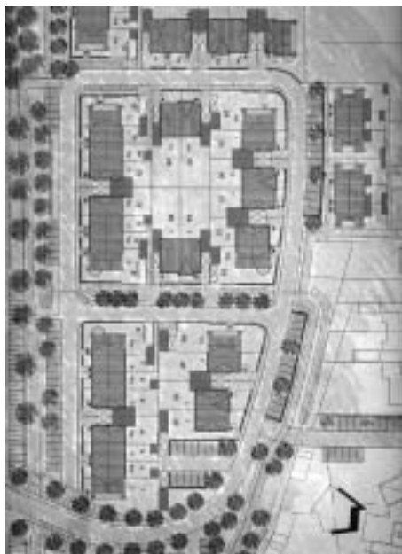
Kaartje met geplande huizen aan Vierkante Bosje. Op de plaats van de vroegere sloten bij oost- en noordgrens van het bosje komen singeltjes. Aan de oostkant zijn ook de zes woningen voor senioren van de NH-kerk aangegeven.

ning verkrijgen. Even leek nieuwbouw op percelen ten noorden van de Nieuweweg uitkomst te bieden, maar er rezen te veel bezwaren van mensen die daar dicht bij woonden. De Laarder Courant de Bel kopte in maart 1974: "Raad teleurgesteld over mislukken plan grondaankoop". Uiteindelijk werd een oplossing gevonden door verlenging van de Streefoordlaan. De Gemeente kon de eeuwigdurende erfpacht van een deel van de tuinen van bewoners van nr 20 en 42 afkopen en kocht de benodigde grond van de NH-kerk en toenmalige andere eigenaren. Door loting werden percelen toegewezen aan de bewoners van 8 te slopen huizen van Laarderweg en Nieuweweg. Dat was in de zomer van 1974.