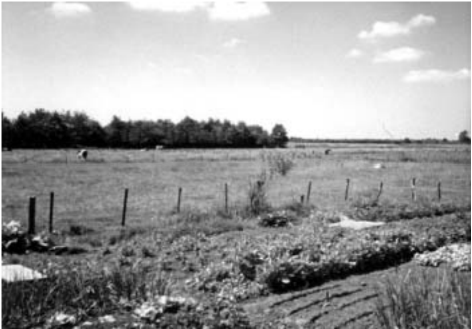
Noordwestflank Vierkante Bosje; gefotografeerd vanuit de achtertuin van Laarderweg 89. (foto ca 1972: Henk van Hees).

Het Vierkante Bosje was niet zo maar een stelletje bomen. Het had iets pastoraals, landelijk schoon. Om goed te beseffen wat het was, moet het Bosje gezien worden in zijn omgeving: kleine akkertjes, kleine weilanden, slootjes en