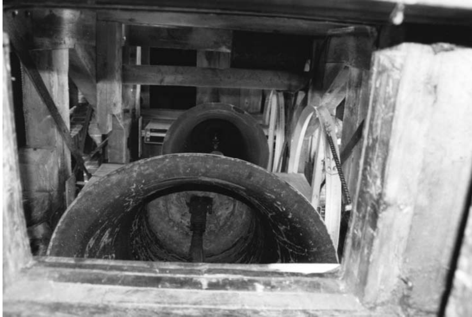
De twee luidklokken van onder gezien.

Waar de Hemony's zich in 1642 in Zutphen vestigden, begonnen de Petit's hun activiteiten in Nederland ruim een halve eeuw later vanuit het Limburgse Nederweert.